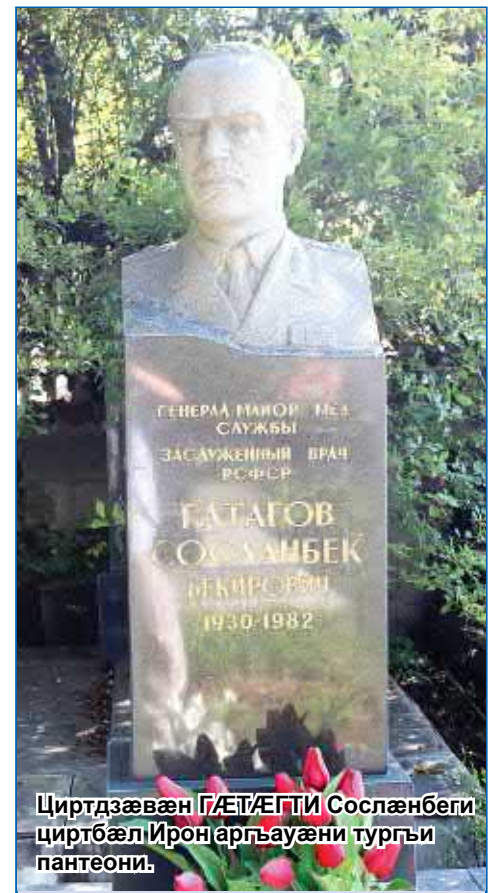
Циртдæвæн ГÆТÆГТИ Сосланбегти циртбæли Ирон аргъауæни турги пантеони:

– Раст мæмæ нæ кæсуй, нæ кадгин æмзæнхони ном нæуæгдзæути къуар ке нæ