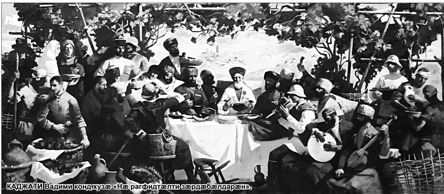
КАДЖАТИ|Вадими кондхузæ «Нæ рафидтæлти зæрдæбæлдарæн.»