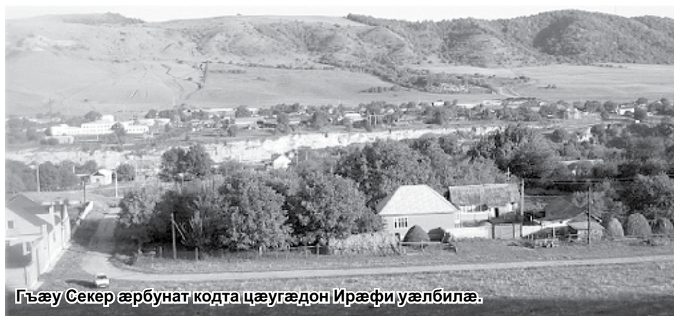
Гъæу Секер æрбунат кодта цæугæдон Ирæфи уæлбилæ.

Дабони гъæдгæс æрдозти кæрдæг Хуасæн фæккарста. Гætæгти инæлар Сæрæн Сослæнбег дохтири устур ном Хуарзæй фæххаста.