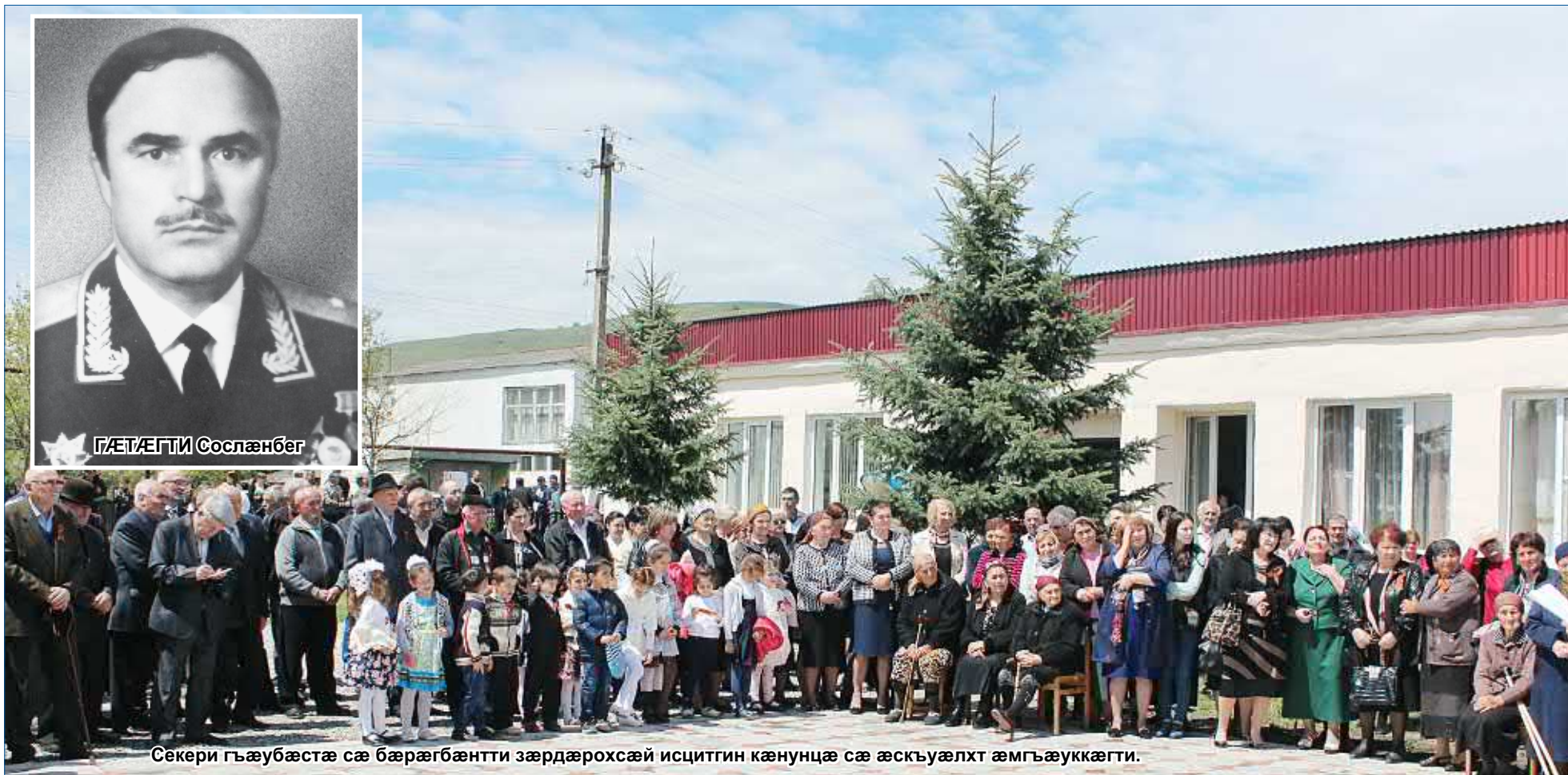
Секери гъæубæстæ сæ бæрæгбæнтти зæрдæрохсæй исцитгин кæнунцæ сæ æскъуæлхт æмгъæуккæгги.

Секери дзиллæ æма сæмæ алли рауæнтæй ци берæ уаызгутæ æрцудæй, етæ дæр хъæбæр зæрдæхцæуæнæй бæрæг кодтонцæ гъæуи равзурди бæрæгбон. Аллихузон мадзæлттæй хъæбæр исфедудта бæрæгбон. Адтæй си агъазиу концерта. Еуафони сценæмæ, нæ национ уæледарæс сæбæл, уотемæй рацудæй лæгти къуар. Æма уæлдæфи идæрдтæбæл нийазæлдæй: