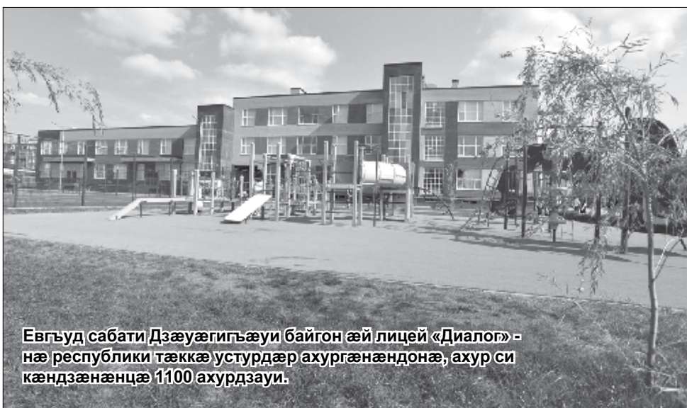
Евгуд сабати Дзæуæгигъæуи байгон æй лицей «Диалог» - нæ республикæ тæккæ устурдæр ахургæнæндонæ, ахур си кæндзæнæнцæ 1100 ахурдзауи.