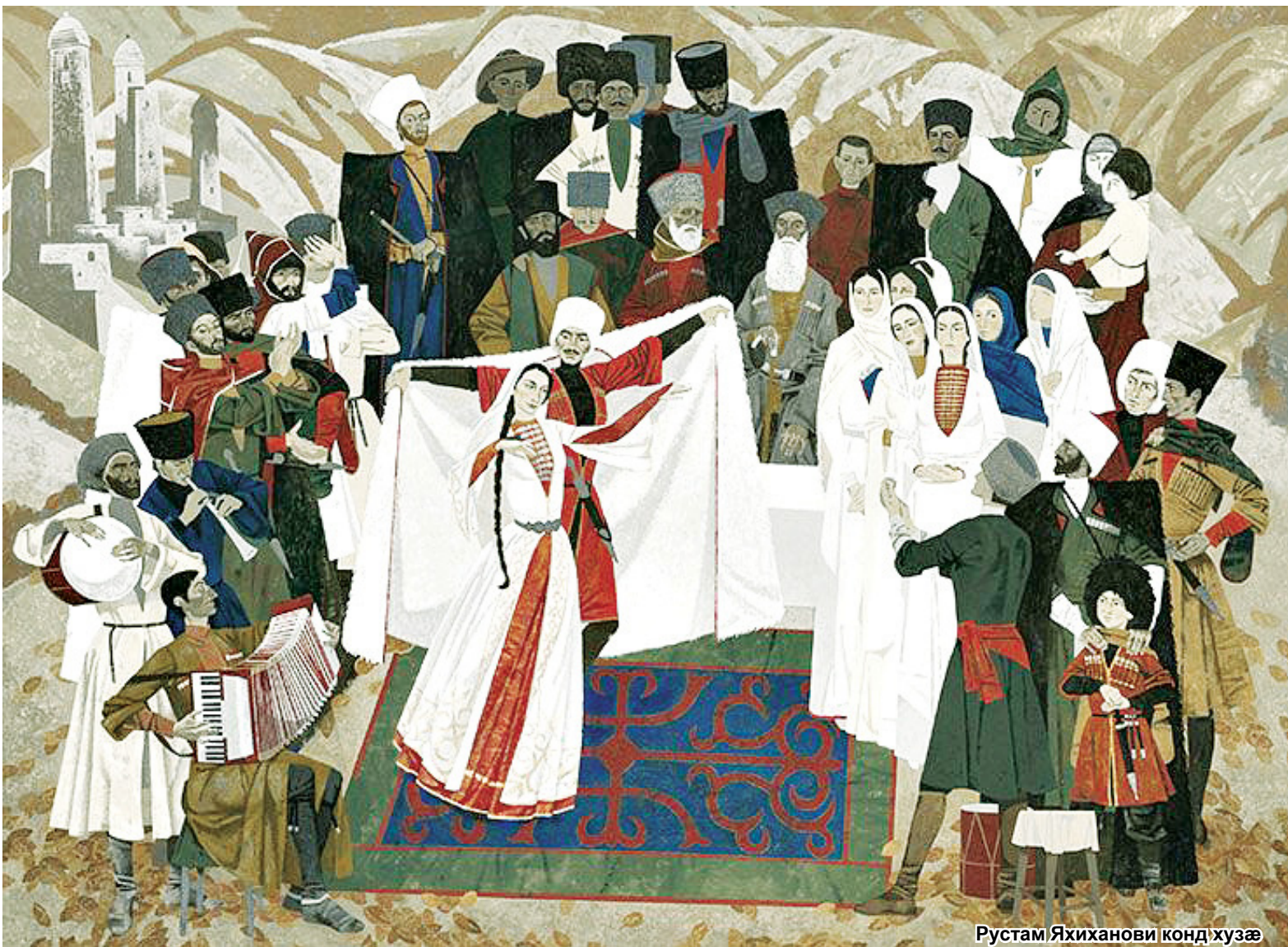
Рустам Яхиханови конд хузæ