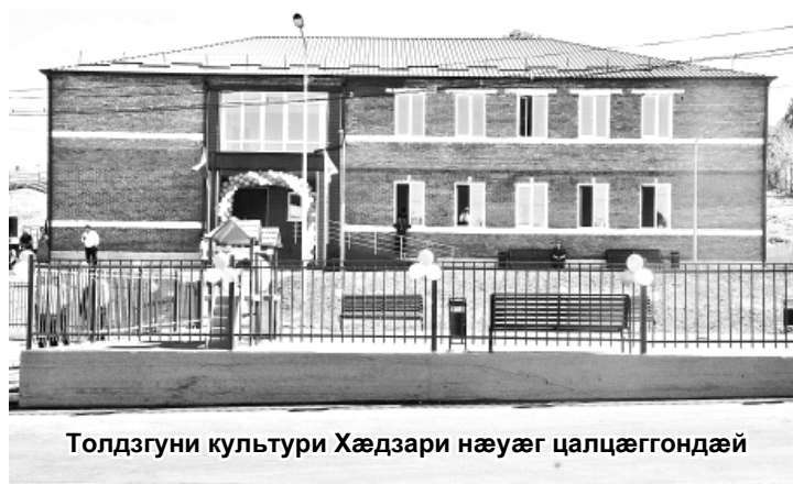
Толдзгуни культури Хæдзари нæуæг цалцæггондæй