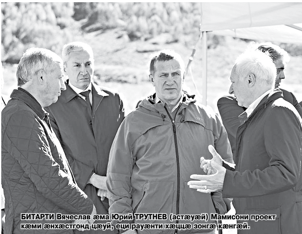
БИТАРТИ Вячеслав æма ЮРИЙ ТРУТНЕВ (астæуæй) Мамисони проект кæми æнхæстгонд цæуы, еци рауæнти хæццæ зонгæ кæнгæй.

Нæ республици косæг балций адтæй Уæрæсей Федераций Хецауади Сæрдари хуæдæйæвæг Юрий ТРУТНЕВ.