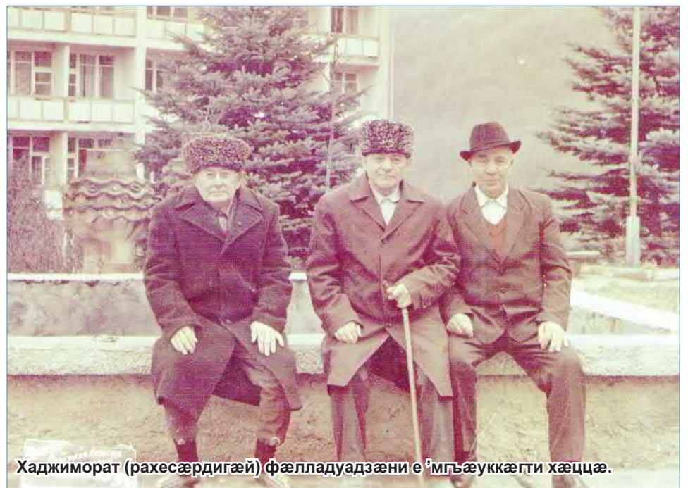
Хаджиморат (рахесæрдигæй) фæлладуадзæни е 'мгъæуккæгти хæццæ.

Дадой хуарз ку нæ зудтайдæ е 'мгарæ æмгъæуккаг Кертанти Тæхири, адтæнцæ кæрæдзæбæл æхцул æрдхуæрдтæ. Тæхир зундгонд адтæй æнæгъæнæн республикни дæр куд журналист æма поэт. Æма ин Дадой е 'мдзæвгитæ куд нæ зудтайдæ. Ахид си кæцидæрти дæр радзоридæ.