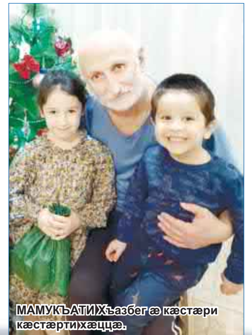
МАМУКЪАТИ Хъазбег æ кæстæри кæстæрти хæццæ.