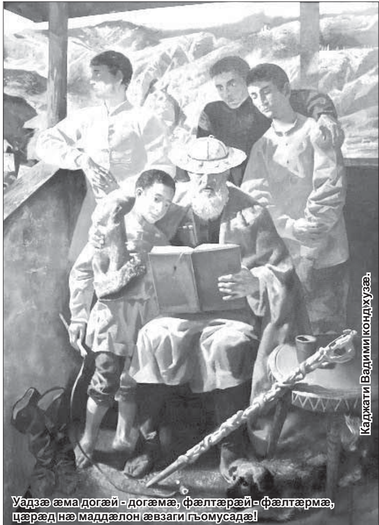
Уадзæ æма догæй - догæмæ, фæлтæрæй - фæлтæрмæ, цæрæд нæ маддæлон æвзаги гъомусадæ!

Мæ маддæлон æвзаг базудтон, фиццагидæр, мæ мадæй. Гъæуама 'й игъосгæ рацæуæн нийерæгæй...»