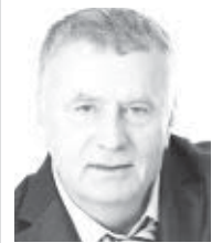
Владимир ЖИРИНОВСКИЙ, Уæрæсей либералон-демократон партий раздæуæг: «Мах афойнадæбæл нæ æрахæссæн исонибони фæтæгити æма революционерти, æма уой фæсте ба ма гъст кæнæн, гъома, кæмидæрти нæмæ цидæр æрцудæй, зæгъгæ...»