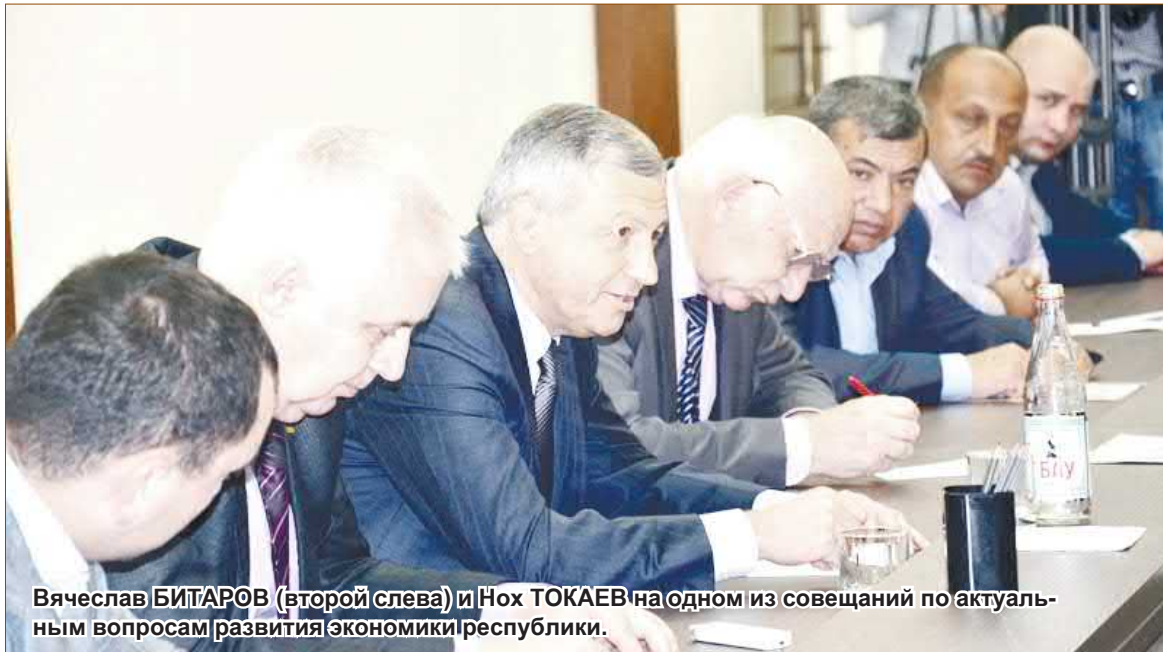
Вячеслав БИТАРОВ (второй слева) и Нох ТОКАЕВ на одном из совещаний по актуальным вопросам развития экономики республики.

Давно определился в понимании достижения успеха – иметь превосходство в знаниях. Для меня это есть определяющей ос-