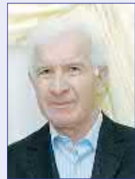
БАЛИКЪОТИ Тотраз, историон наукити доктор, Уæрæсей журналистти Цæдеси иуонг