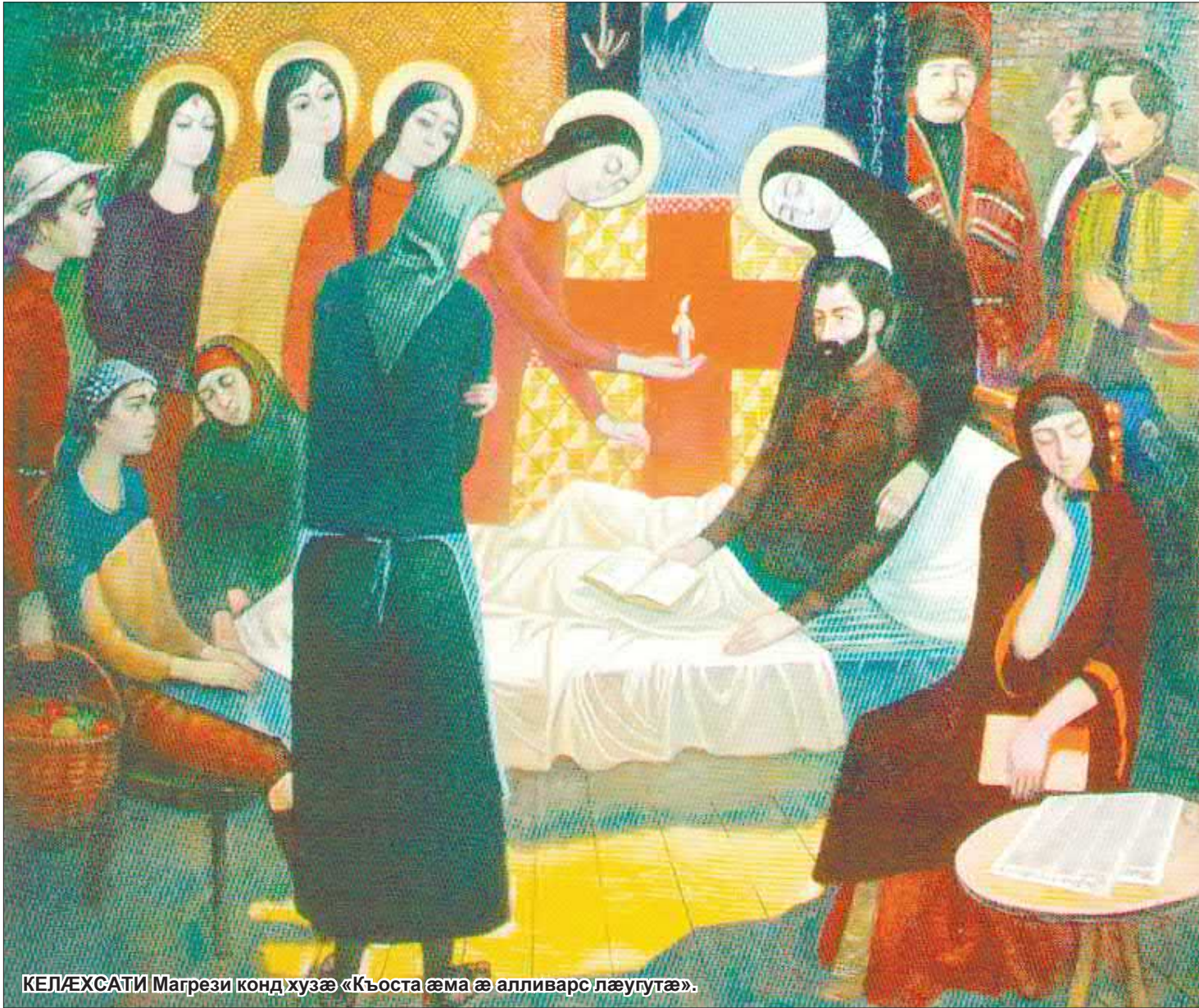
КЕЛÆХСАТИ Магрезидæ конд хузæ «Къоста æма æ алливарс лæугутæ».

уосæ. Ахургонд уосæ коммæ нæ фæккæсуй...»