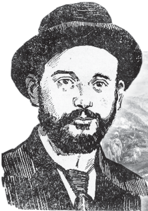
ЦÆГОЛТИ Геуæрги райгурдæй 1871 анзи 22 апрели Киристонгъæуи (нур – сахар Дигора).