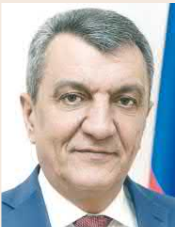
Республикæ Цæгат Иристон-Аланий æнæнездзийнадæ гъæуайкæнуинади кадгин косгутæ!

Зæрдиагæй уин арфæ кæнун уæ профессионалон бæрæгбони – медицинон косæги Бони фæдбæл. Сумах равзурстайтæ хъæбæр ахсгаг æма гъæугæ дæснадæ – адæми æнæнездзийнадæ гъæуай кæнун, сæ нестæй сæ дзæбæх кæнун, зæрдрохс цардмæ сæ æздахун. Цæйбæрцæбæл агъазиау бухсундзийнадæ, разæнгарддзийнадæ, уоди гъардзийнадæ æма устур зонундзийнадæ уи агоруй дохтири куст!