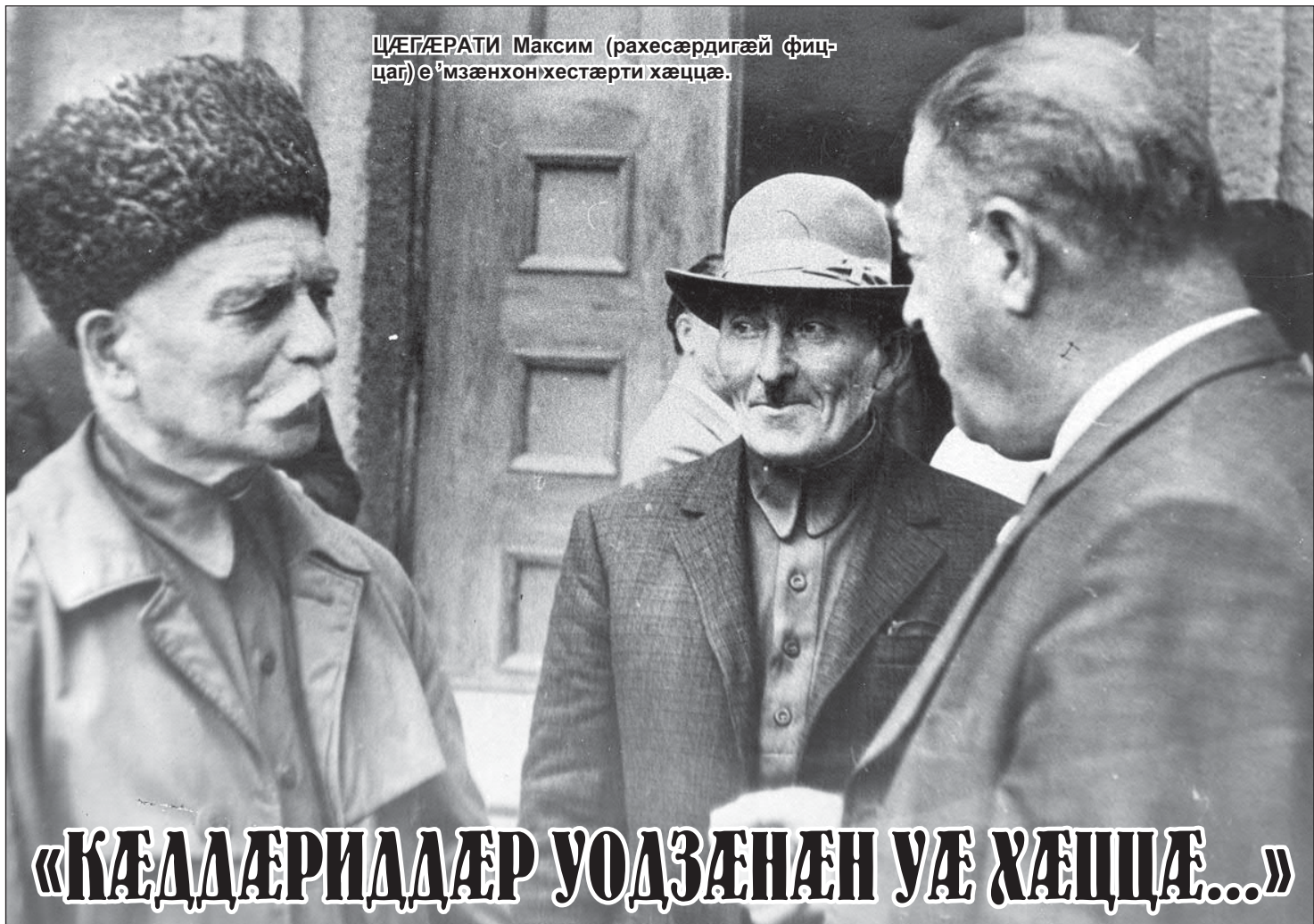
ЦÆГÆРАТИ Максим (рахесæрдигæй фиц-цаг) е 'мзæнхонхæстæрти хæццæ.

О тайне сегодня пою я открыто, — О счастье большем, что в груди моей скрыто. Да, было давно. Счастливый тот день, словно сон, вспоминаю, Познал, как Куртата гостей привечают. Да, была весна. — О, гость из Уалладжыра! — радость я помню, Как жданного друга встречали с гармонью. Да, была весна. Меня старики пригласили к застолью, И женщины щедрость явили хлеб-солью. Да, была весна. От пляски джигитов и горы дрожали, В Уалладжыр их песен слова долетали. Да, была весна. С гармонью пришла ты, как чуда явление, Как ангел, ты вергла людей в изумление. Да, была весна. Кого-то от взглядов в тот день обжигало, И в ком-то душа от любви трепетала. Да, была весна. Тот день вспоминаю, в тот сказочный вечер, Ты в сердце моем поселилась навечно. Да, была весна.