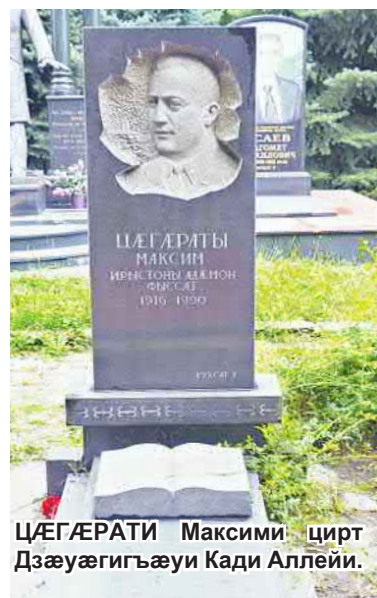
ЦÆГÆРАТИ Максими цирт Дзæуæгигъæуи Кади Аллейи.

РЕДАКЦИЙÆЙ: Цæгæрати Максими уадзимистæй абони мухур кæнæн æ цубур радзурдтæ (6-аг фарсбæл). Уæдта ма уой дæр зæгъун гъæуи, æма æ уадзимистæн сæ фулдæр тæлмацгонд æрцудæнцæ уруссаг æма Советон Цæдеси адæмхæтти-тæй берети æвзæгтæмæ. Æма ма абони мухур кæнæн е 'мдзæвгитæй цалдæр уруссаг æвзагмæ тæлмацгондæй (7-аг фарсбæл). Ратæлмæц сæ кодта БРИТЪИАТИ Аслæнбег.