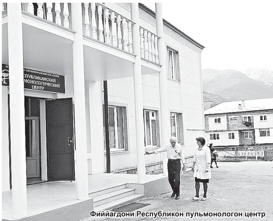
Фийагдони Республикон пульмонологон центр

Французæг финсæг Гюстав ФЛОБЕР (1821-1880) финста: «Æхсæнади бартæ куд тæбуйаг æнцæ, уотæ табуйаг æнцæ еу адæймаги бартæ дæр, æма еци æнæмæнгæ æцæгдзийнади нихмæ неци æрæвæрæн ес, тухмиуæй æндæр... Адæми кадæ æма намуси туххæй дзубандитæ мæмæ хаттæй-хатт айуани хузæн кæсунцæ...»