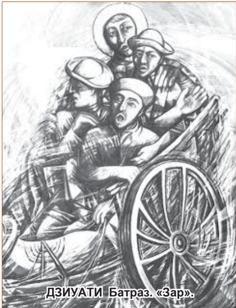
ДЗИУАТИ Батраз. «Зар».