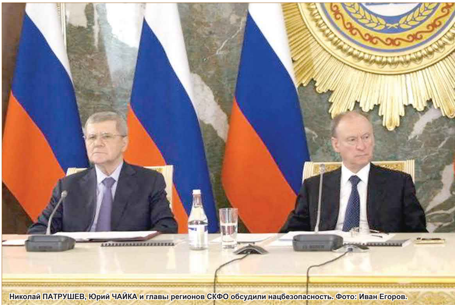
Николай ПАТРУШЕВ, Юрий ЧАЙКА и главы регионов СКФО обсудили нацбезопасность.

Председатель Следственного комитета Российской Федерации Александр БАСТРЫКИН поручил возбудить уголовное дело о разработке биологического оружия на территории Украины. Нашими следователями будут устанавливаться все обстоятельства, связанные с разработкой биологического оружия вблизи территории Российской Федерации».