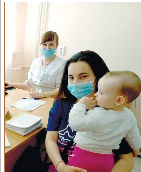
Медицион профилактики республикон центр

Республикæ Цæгат Иристон-Аланий мухур æма дзиллон коммуникаци гъуддæгуги Комитети пресс-службæ