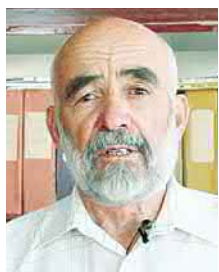
ХЪОДЗАТЫ Æхсар (1937–2021), Цæгат Ирыстоны адæмон поэт

Дыууæ ныхасы дыгурон æвзаджы тыххæй. Мæнмæ гæсгæ йын ирон æвзагимæ æмхуызон бартæ раттын хъæуы, афон у æнæсæрфат дискусситæн кæрон скæнынаен. Дæ нацийы арфдæр, фидардæр уидæггæй иу барæй лыг кæн — уымæй æдылыдæр ми ма цы уа! Дыгуримæ иу туг, иу стæг стæм. Гъемæ бинонтæй искæцыйæн йæ дзыхыл цъутта куы æвæрай, дæлдзынгæй æй куы кæнай, уæд бинонтæн æнгом уæвæн и? Искæцы дзырды истори нæ раиртасын куы фæфæнды, уæд ын йæ уидаг дыгурон æвзаджы куы агурæм æмæ йын йæ апмæ уый фæрцы куы баххæссæм, уæд цæмæн æвæраем цæлхуртæ нæхицæн? Уæдæ ныуадзæм дыгуры «сæ адыл» (Къостайы ныхас)! Уадз æмæ иримæ иумæ æмсæр-æмдыхæй аразой сæ цард!