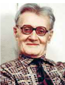
Васо АБАЕВ (1901-2001), академик: