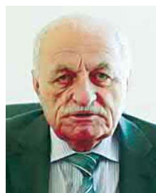
ДЗАСОХТЫ Музафер, Цæгат Ирыстоны адæмон поэт

Дæ хурвæлыст æрвон зæлтæ куы хъусон, уыдзынæн уæд Ирæф-донау æнусон, уыдзæн цæлгæт, нæ уыдзæни мæлгæт!