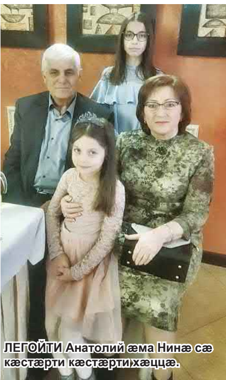
ЛЕГОЙТИ Анатолий әма Нинә сә кәстәрти кәстәртихәццә.