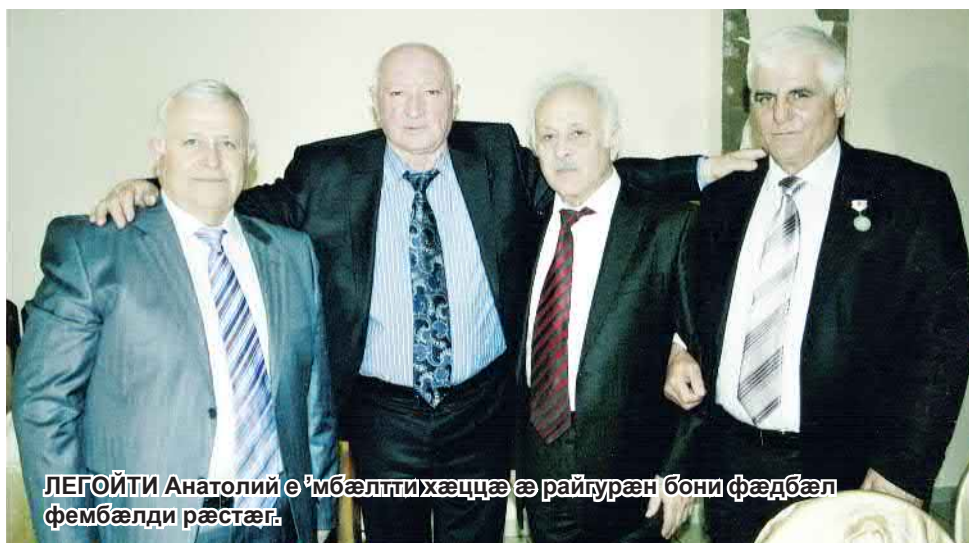
ЛЕГОЙТИ Анатолий өймбэлтихэццэ э райпураэн бони фэдбэл фембэлди рэстэги.

Ама еци ихэст тэккэ хуэздэр хуки аенхэстгонд аэрцудэй.