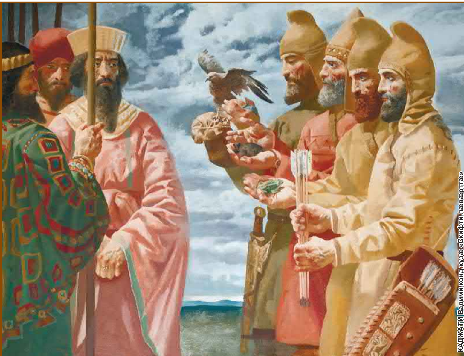
КАДЖАТИ Вадими кондхузæ «Скифти лæвæрттæ»