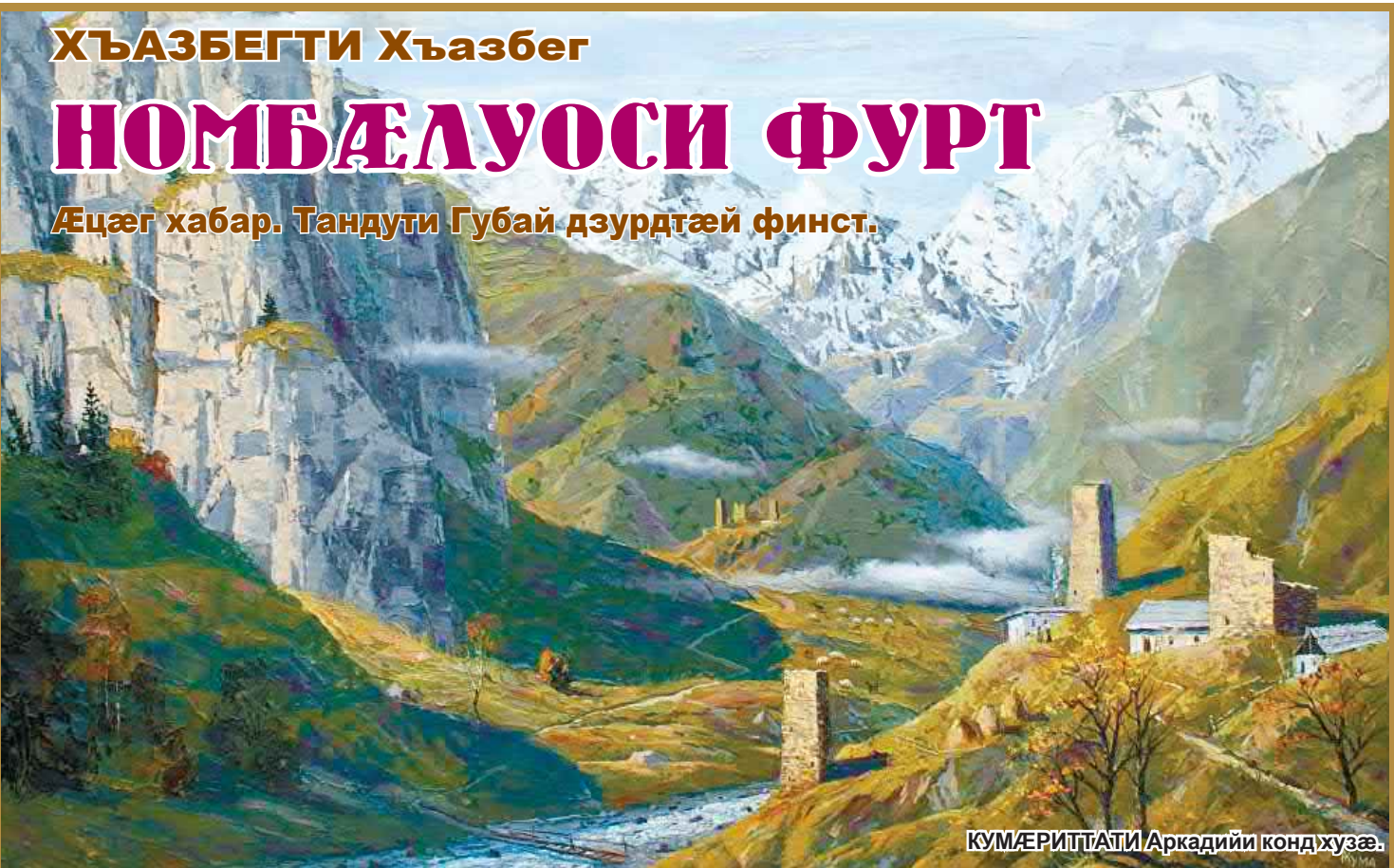
КУМÆРИТТАТИ Аркадийи кондхузæ.

Æцæг хабар. Тандути Губай дзурдтæй финст.