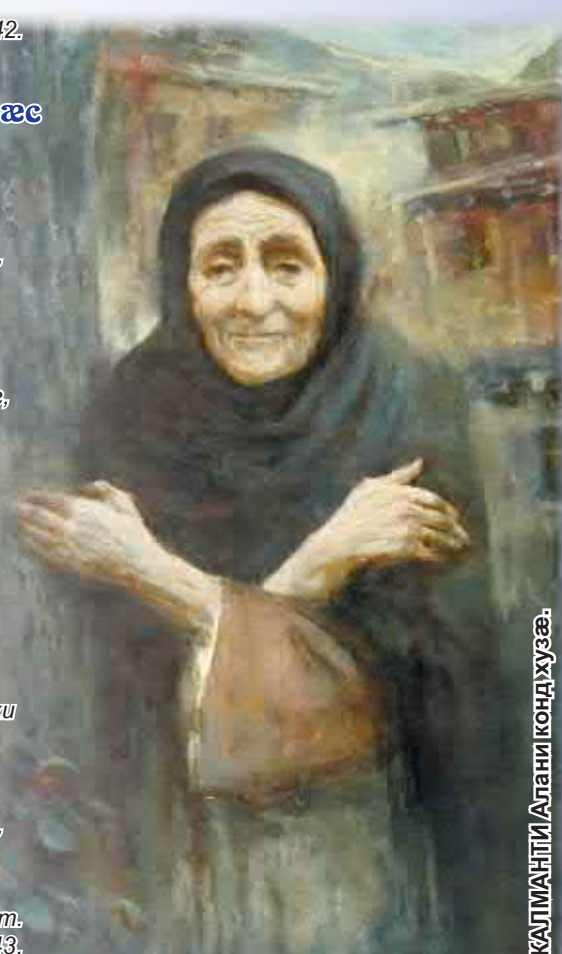
КАЛМАНТИ Алани кондхузæ.

Æринцадтæ, гъо, баймир дæ! Зæрдæ нирристæй. Сау бон... Сауæхседтмæ, хорискастмæ Адтæй дæуæн дæ фæндон!..