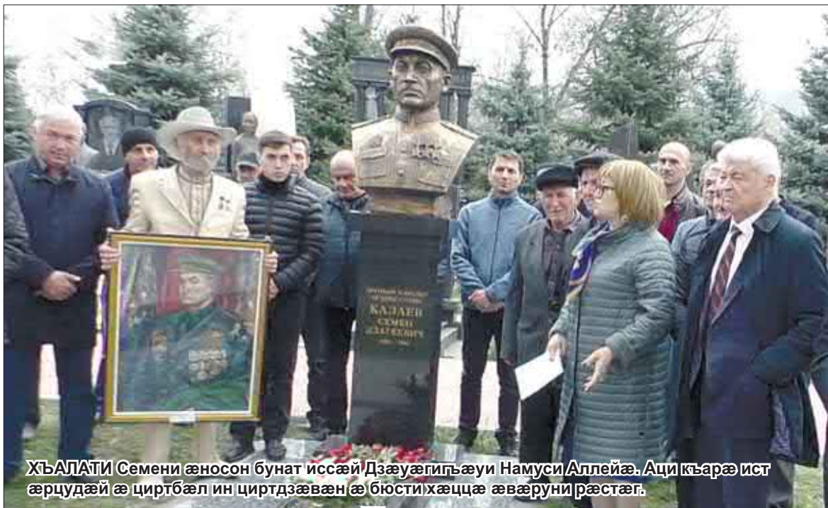
ХЪУЛАТИ Семени æносон бунат иссæй Дзæуæгигъæуи Намуси Аллейæ. Аци къарæ ист æрцудæй æ циртбæл ин циртдзæвæн æ бюсти хæццæ æвæруни рæстæг.