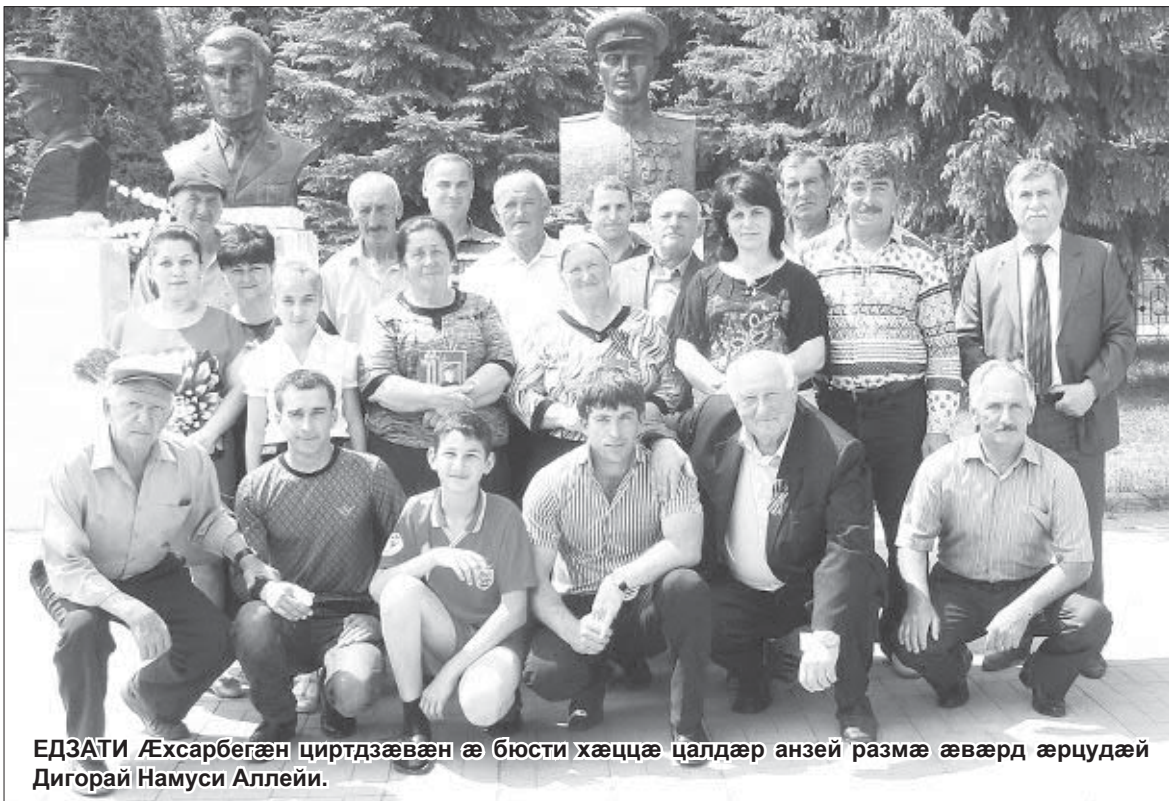
ЕДЗАТИ Æхсарбегæн циртдзæвæн æ бюсти хæццæ цалдæр анзей размæ æвæрд æрцудæй Дигорай Намуси Аллейи.

сæйрагдæр менеугутæ. Æз кæнун хумæтæг тугъдон лæги кой. Æфсади рæнгъити фулдæр ес уæхæн адæм. Æма етæ надбæл ку фæрраст унцæ, уæд уони гæйафун гъуддаг æй. Е æ бон кæмæн нæй, е æй æнамонд. Дæ хæццæ ци фæсæвæд уа, уони æмрæнгæ цæун ба дæ бон ку уа, уæд дæхе гъæуама хонай амондгун...»