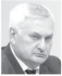
КУЧИТИ Заур, Цæгат Иристони экономикон райрæзти министр