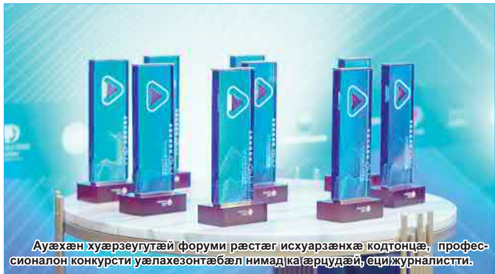
Ауæхæн хуæрзеугутæй форуми рæстæг исхуарзæнхæ кодтонцæ, профессионалон конкурсти уæлахезонтæбæл нимад ка æрцудæй, еци журналистти.