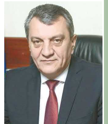
Сергей МЕНЯЙЛО, Цæгат Иристони Сæргълаууæг:

Хъурманти райдзаст æма нифсдæттæг бæрæгбони фæдбæл Цæгат Иристони дзиллæн арфæ кæнунцæ: