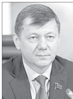
Дмитрий Новиков, заместитель Председателя ЦК КПрФ

14–15 июня в Минске прошла международная парламентская конференция «Историческая память: Великая Победа, добытая единством». Состоялся насыщенный обмен мнениями с участием руководства обеих палат белорусского парламента и делегаций Армении, Казахстана, Таджикистана, Туркменистана, Узбекистана.