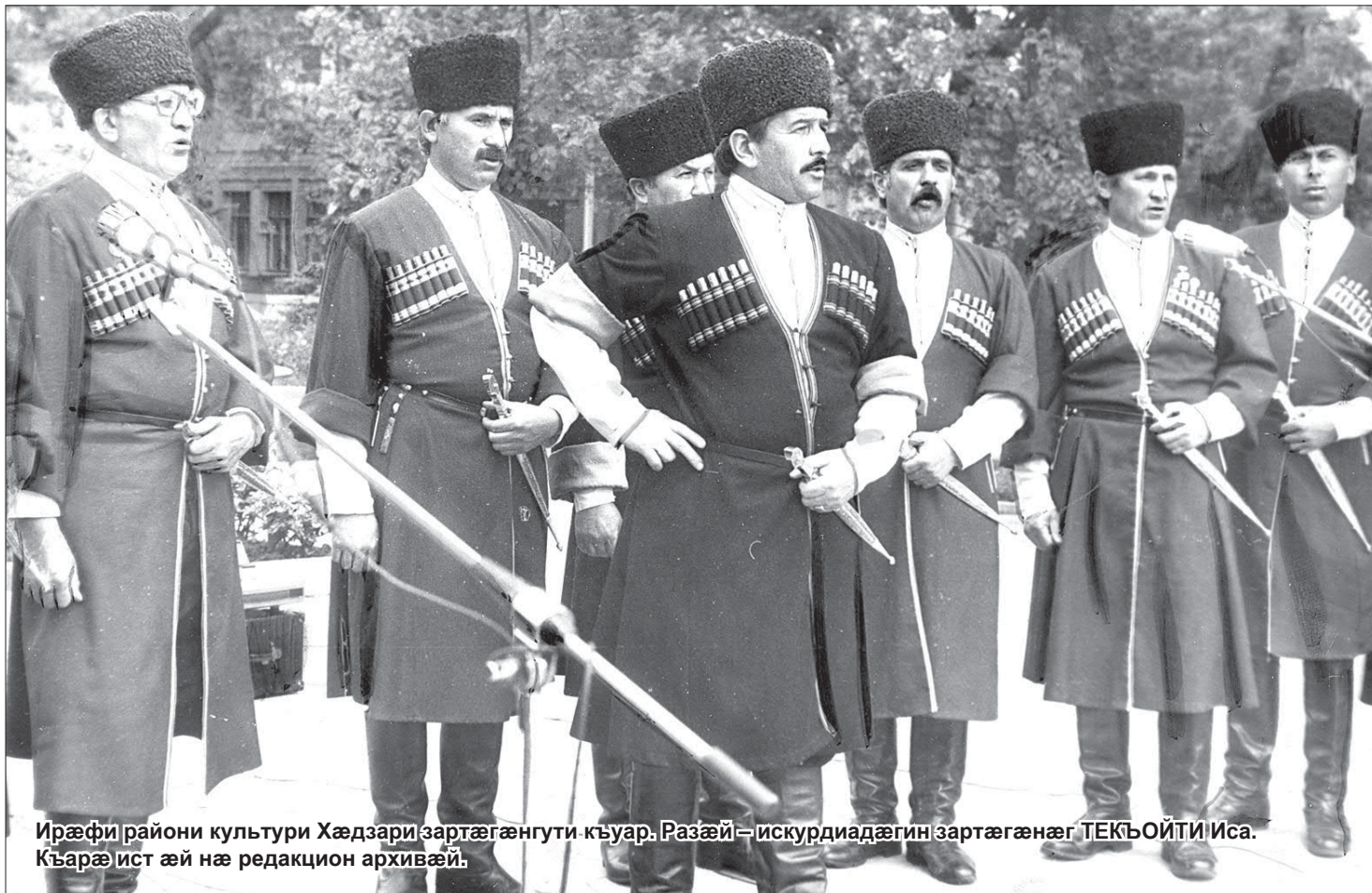
Ирæфи райони култури Хæдзари зартæгæнгутти къуар. Разæй — искурдиадæгин зартæгæнæг ТЕКЪОЙТИ Иса. Къарæист æй нæ редакцион архивæй.

Гъей дæлæ зæгъуй, уорс Елиай цæфтæй Æносон зæнхæ уæззау низмæлуй. Нæртон Алихан тугъди будури Цъамар æзнæгæти наси карст кæнуй. Гъей мæнæ зæгъуй, хуарз цауæйнон, дан, Берæгъи фæдбæл кæронмæ цæуй, Дигори номгæнæг нæ фудæзнаги Æхе лæгæти æдæрсгæ цæуй. Гъей зæгъуй мæнæ, фæскæвда хор бон Зæрдæ ма цæстæн уæлдай адгин æй. Бæгъатæр Алихан æ гъæубæстæмæ Ку æридæхуй устур кадгинæй. Гъей уæртæ, зæгъуй, нæ фæдар толдзæ И карз думгити ку нæ фезмалдæй, И цъæх уалдзæги и хори гъармæ Æнæнгæлтти уæд цæмæн ракалдæй! Сау уг ниууаста Чиколай сæрмæ: «Уæ лæгдæри уин сау нез фæххаста!» Махъоти Алихан рохсаг æрбауй, Æзнаг басæтгæй, фат ке нæ райста!