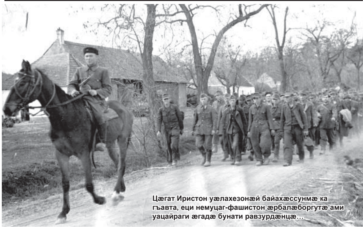
Цæгат Иристон уæлахезонæй байахæссунмæ ка гъавта, еци немуцаг-фашистон æрбалæборгутæ ами уацайраги æгадæ бунати равзурдæнцæ...

Сталингради тугъди райдайæнæй æма уоми Сурх Æфсади фæууæлахезæй фæстæмæ Устур Фидибæстон тугъди тохи будурти сæрмæ радумтонцæ æндæр думгитæ.