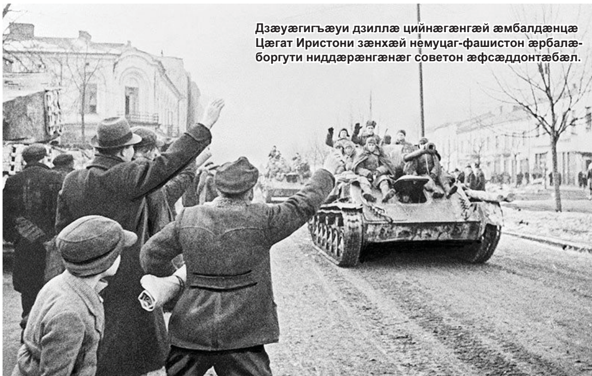
Дзæуæгигъæуи дзиллæ цийнæгæнгæй æмбалдæнцæ Цæгат Иристони зæнхæй немуцаг-фашистон æрбалæ-боргути ниддæрæнгæнгæ советон æфсæддонтæбæл.