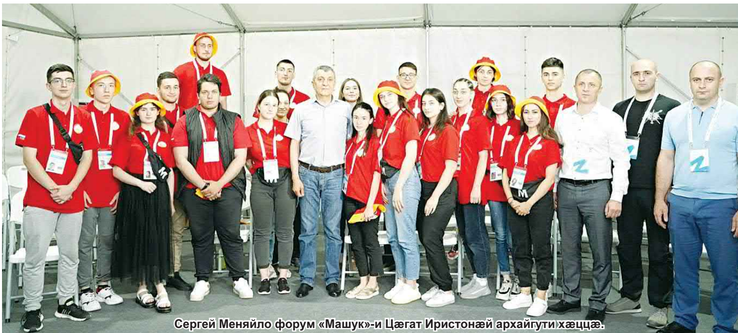
Сергей Меняйло форум «Машук»-и Цæгат Иристонæй архайгити хæццæ.

Рабиндранат ТАГОР (1861-1941), Индий дзурддзæугæ лæг: «Алли наци дæр гъæуама æ еугур медхъауритæ равдеса æнæгъæнæ дуйней размæ. Кæд дуйнейæн неци раттунгъон æй, уæд е ба гъæуама нимад æрцæуа национ фудракæндæбæл. Е мæлæтæй фуддæр æй, æма ин адæмти истори нецихузи ниббардзæнæй...»