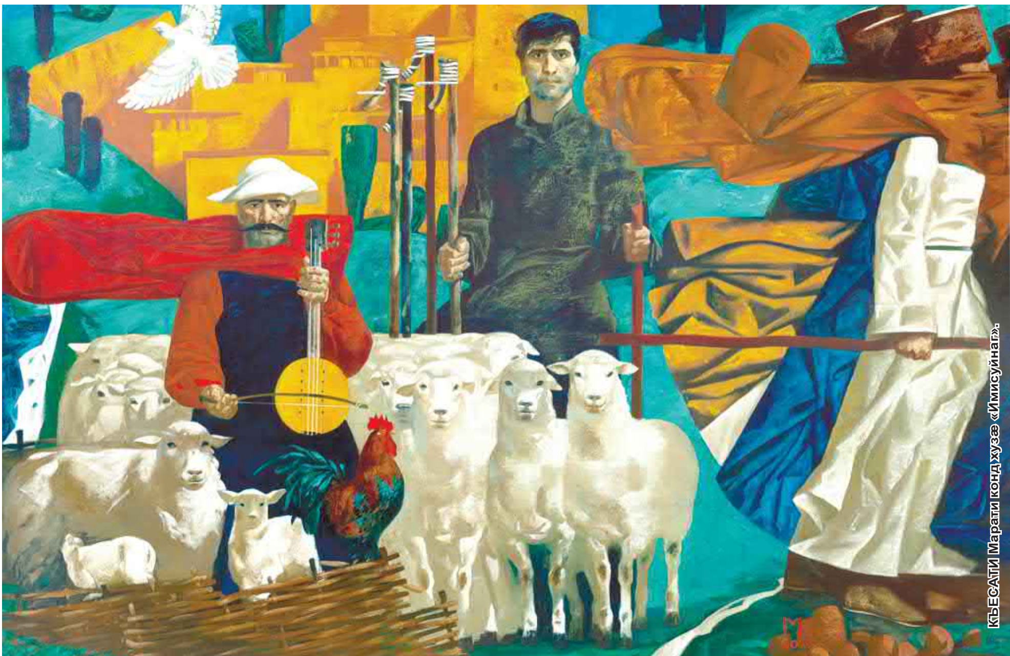
КЪÆСАТИ Шараги конд хуæзæ «Имисунаг»

ЗУНДИ ХУАРЗ АГОРÆ ДÆХЕ АДÆМИ УОДВАРНИ ХÆЗНАДОНИ!..