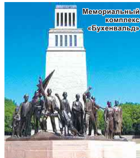
Материал подготовлен на основе информации РИА Новости и открытых источников