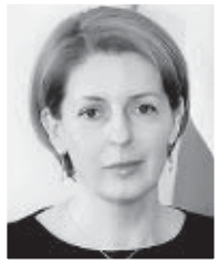
АЙДАРТИ Алинаэ, республикы фэллоинэ эма социалон райрэзти министр