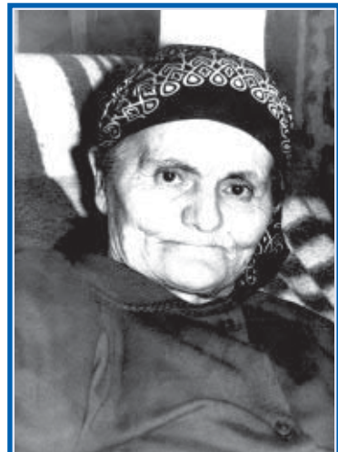
Черчести Хъасболати исфæлдистади уæлдай тавуйæгæй зиннуй Мæди сорæт. Æма е хумæтæги нæй – æно-стæмæ имисуйнаг ин æй абони дæр ма æ мадæ Фаризæт (Æчети кизгæ)... Сæрустур си æй – гъæубæсти 'й абони дæр ма æримисунцæ – уоййасæбæл æгъдаугин æма зундгин силгоймагбæл нимад адтæй. Æ цæуæти дæр еци хузи – æгъдаугин æма рæстуод унбæл – исгъомбæл кодта.

æ æригони рæстæги финста æмдзæвгитæ, уой дæр хуарз æмдзæвгитæ. Фæстæдæр ба, æвæдзи, еци фæлгæт ин æ исфæлдистадон гæнæнтæн нæбал фагæ кодта æма райдæдта