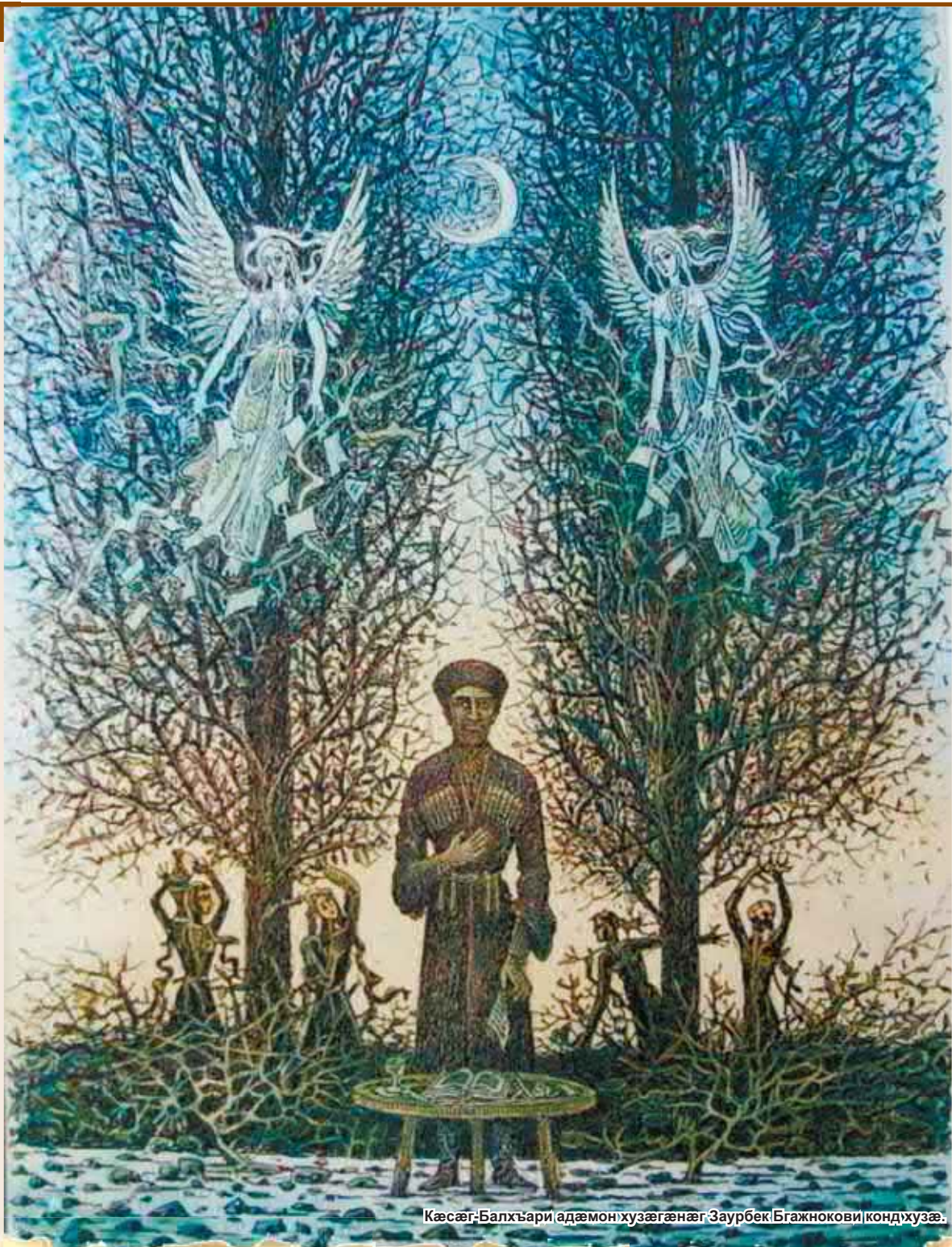
Кæсæг-Балхъари адæмон хузæгæнæг Заурбек Бгажнокови кондхузæ.

Уотæ æнæргъудийæй райзадæй хуæрзауодундзийнади Æхсæндуйнеуон бон – бæрæггонд гъæуама цæуа 5 сентябри.