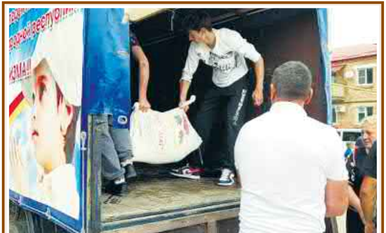
Цæгат Иристони рæстзæрдæ дзиллæ сæ гæнæнтæ æма ра-вгитæмæ гæсгæ агъаз кæнунцæ Донбасси цæргутæн æма сæрмагонд тугъдон операций архайæг уæрæсейæг æфсæддонтæн.