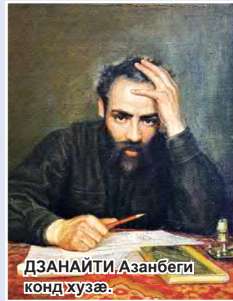
ДЗНАЙТИ АЗАНБЕГИ конд хузæ.