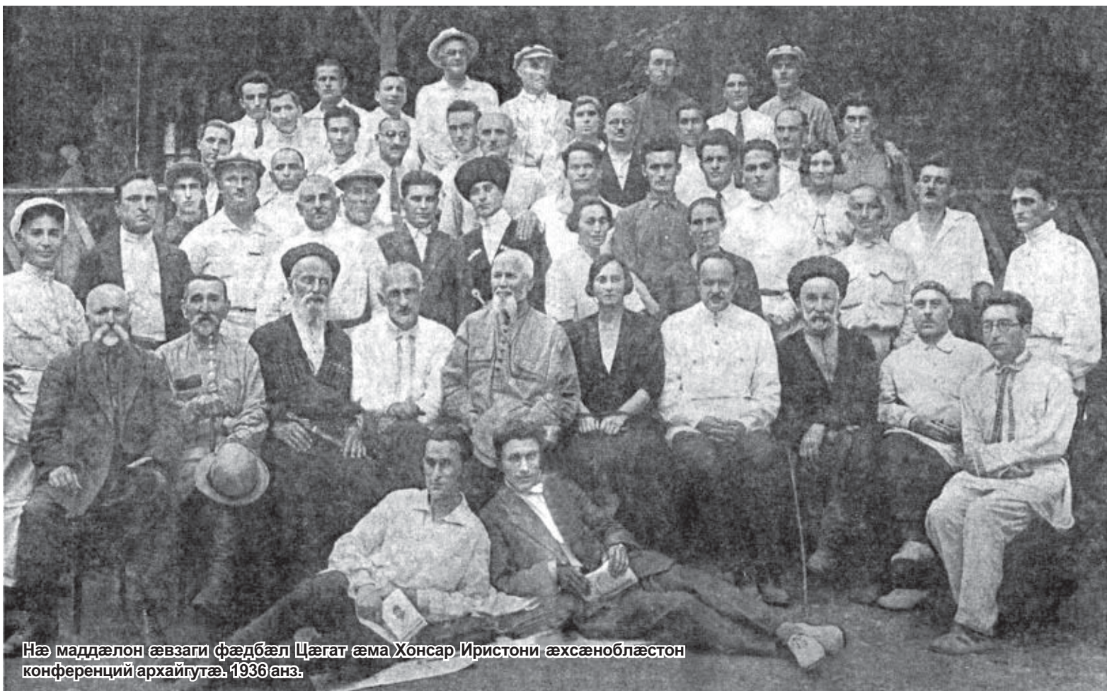
Нæ маддæлон æвзаги фæдбæл Цæгат æма Хонсар Иристони æхсæноблæстон конференций архайгутæ, 1936 анз.