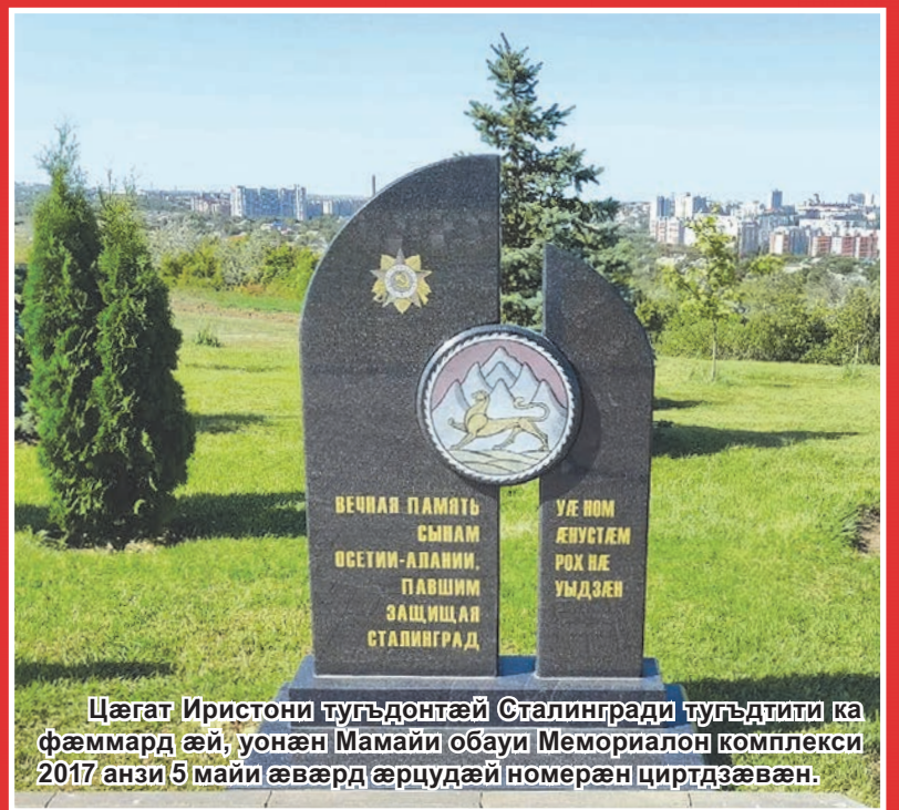
Цæгат Иристони тугъдонтæй Сталингради тугъдтити ка фæммард æй, уонæн Мамаи обауи Мемориалон комплекси 2017 анзи 5 майи æвæрд æрцудæй номерæн циртдзæвæн.