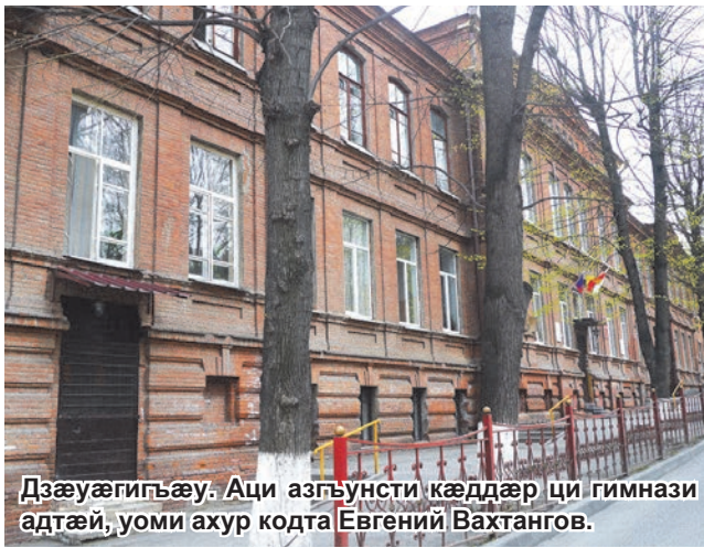
Дзæуæгигъæу. Аци азгъунсти кæддæр ци гимнази адтæй, уоми ахур кодта Евгений Вахтангов.

Владимир НЕМИРОВИЧ-ДАНЧЕНКО (1858-1943), Советон Цæдесу адæмон артист, Евгений Вахтанговæ финста: «Арфаг ди дæн, бæрзонд айивадон цийнæдзийнадæ ке хæссис, дæ ездон æскъуæлхтдзийнадæй, театри нуриккондæр фарстатæ лух кæнунмæ дæ нифс ке хæссис, Айивадон театрген ном ке кæнис, уомæй...»