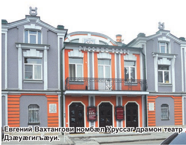
Евгений Вахтангови номбæл Уруссаг драмон театр Дзæуæгигъæуи.