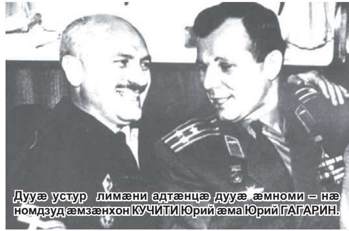
Дууæ устур лимæни адтæнцæ дууæ æнноми – нæ номдзуд æмзæнхон КУЧИТИ Юрий æмæ ЮРИЙ ГАГАРИН!