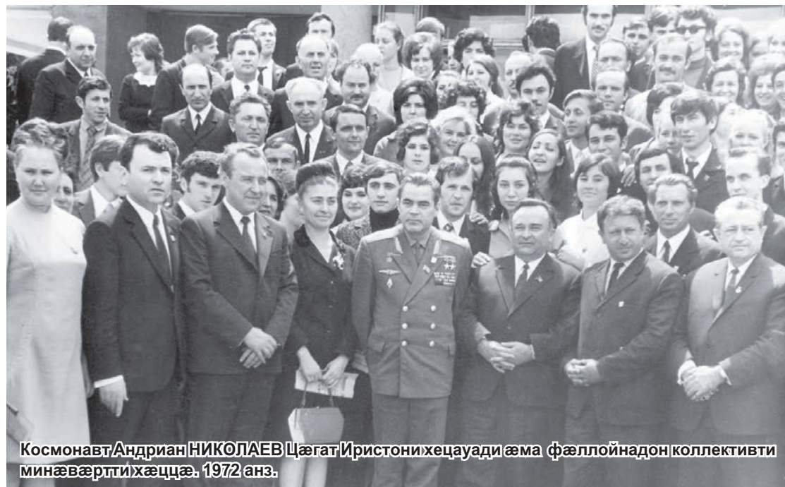
Космонавт Андриан НИКОЛАЕВ Цæгат Иристони хецæуади æма фæллойдон коллективти минæвæртти хæццæ. 1972 анз.

мæнгæ зæгъун гъæуй абони. Космонавтики къабази зундгонд архайæг Къомайти Руслани хъæппæресæй æма уодуæлдай архайди фæрци Дзæуæгигъæуи æртæ анзей размæ байгон æй космонавтики скъола. Цæмæй еци ахсгиаг гъуддаг арæзт æрцудайдæ, уомæн ин хъæбæр фæййагъаз кодта нæ республики уæди Сæргълæууæг Битарти Вячеслав – зæгъун гъæуй уой, æма, ци хæртæ гъудæй, уонæн сæ зингæ-зингæдæр хай æхе фæрæзнитæй радех кодта. Нуртæккæ аци скъола нæ кæстæртæн ис-сæй сæ тæккæ хиццагдæр рауæн. Ка 'й зонуй, æма си кадæртæ исонибони исудзæ-нæнцæ кенæ космонавтæ, кенæ ба космос æсгаруни искурдиадæгин архайгъутæ, æма уомæй уæлдай бæрзондæрмæ исесдзæ-нæнцæ нæ Иристони кадæ æма намус. Бан-тæсæд син!..