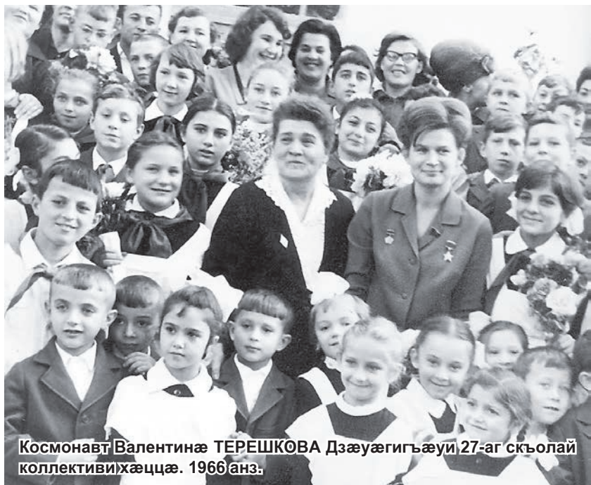
Космонавт Валентинæ ТЕРЕШКОВА Дзæуæгигъæуи 27-аг скъолай коллективти хæццæ. 1966 анз.