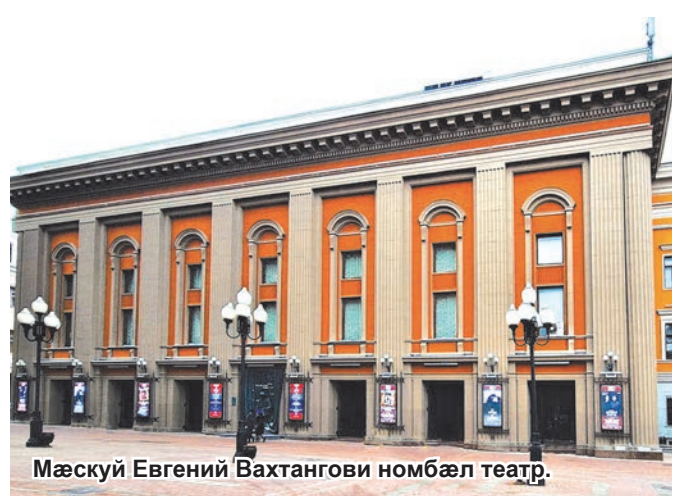
Мæсқуй Евгений Вахтангови номбæл театр.