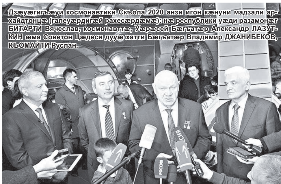
Дзæуæгигъæуи космонавтики Скъола 2020 анзи игон кæнуни мадзали архайдонцæ (галеуæрдигæй рахесæрдæмæ): нæ республики уæди разамонæг БИТАРТИ Вячеслав; космонавтæ, Уæрæсей Бæгъатæр Александр ЛАЗУТКИН æма Советон Цæдеси дууæ хатти Бæгъатæр Владимир ДЖАНИБЕКОВ, КЪОМАЙТИ Руслан.

Космоси мах фиццаг ке адтан, уомæй абони дæр нæ суйни сæрбæл бæрзонд хуæцæн, нæ фæлтæрддзийнадæ нин фæнзунцæ иннæ бæститæ дæр, дæнцæн нæ хæссунцæ. Уæларвон тугъдадæмæ