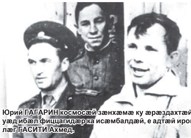
Юрий ГАГАРИН космосæй зæнхæмæ ку æрæздахтæй, уæд ибæл фиццагидæр ка исæмбалдæй, е адтæй ирон лæг ГАСИТИ Ахмед.