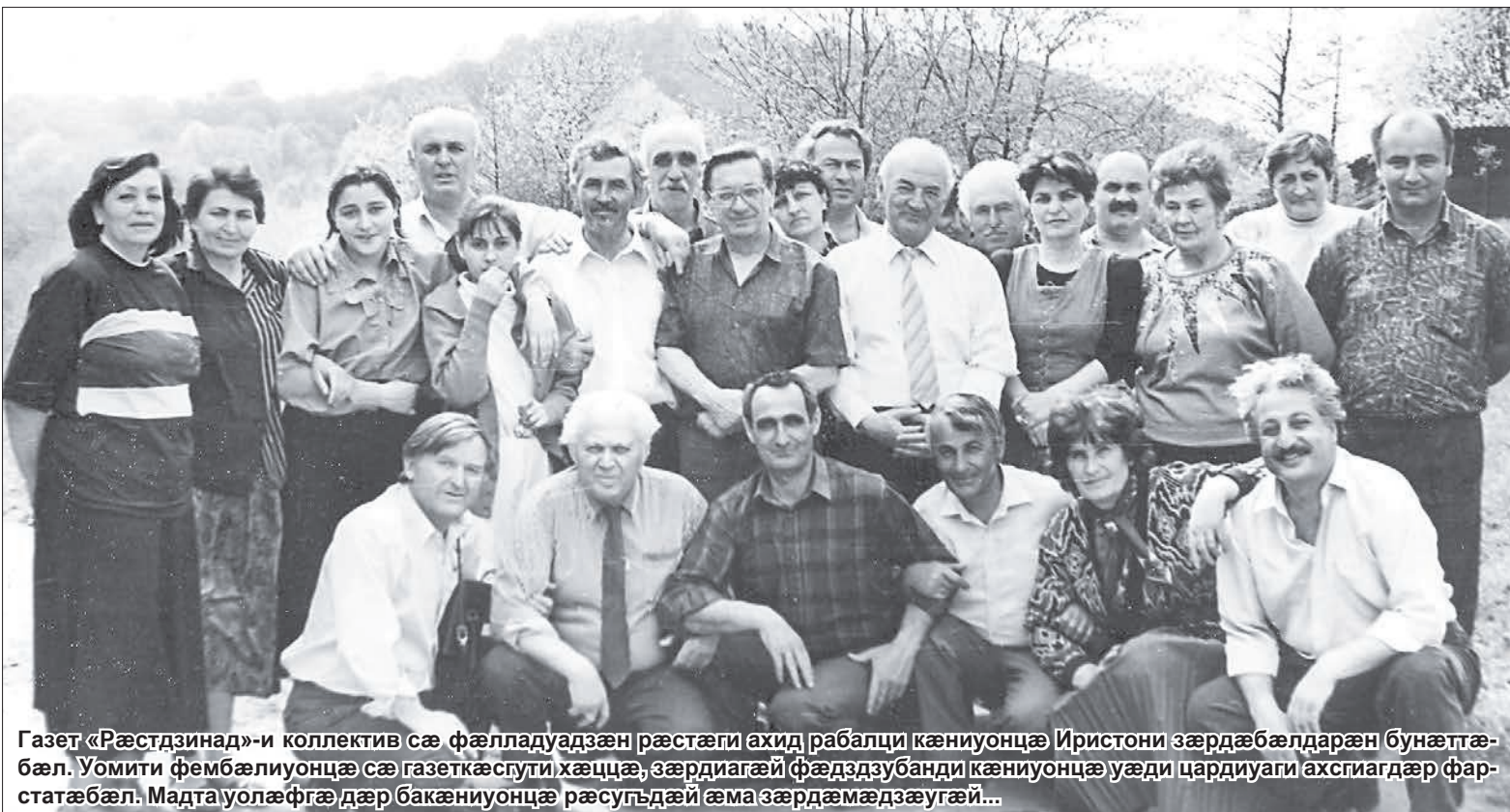
Газет «Рæстдзинад»-и коллектив сæ фæлладуадзæн рæстæги ахид рабалци кæниуонцæ Иристони зæрдæбæлдарæн бунæттæ-бæл. Уомити фембæлиуонцæ сæ газеткæсугти хæццæ, зæрдиагæй фæдздзубанди кæниуонцæ уæди цардиуаги ахсигæдæр фарстатæбæл. Мадта уолæфгæ дæр бакæниуонцæ рæсугъдæй æма зæрдæмæдзæугæй...