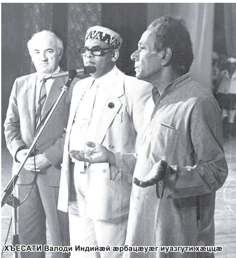
ХЪЕСАТИ Валоди Индийæй æрбацæуæг иуазгути хæццæ