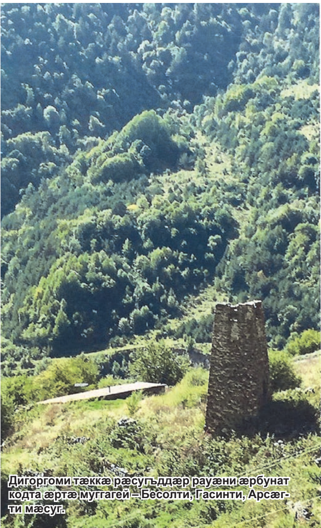
Дигоргоми тæккæ рæсугддæр рауәни æрбунаг кодта æртæ муггагæй – Бесолти, Гасинти, Арсæгти мæсуг.

БЕСАТИ Тазе (1910-1981), финсæг: «Лæгән æ базуртæ, æ къабæзтæ, айдагъ е 'нсувæртæ нæ 'нцæ – адæм сæ еугурдæр; ка 'и фæууарзуй æма æхуæдæг ке уарзуй, хуарзæй æй ка фæннимайуй æма æхуæдæг ке фæннимайуй... Уарзон æма хæларæй ке хæццæ цæрай, етæ дин тогхæстæг, æнсувæр дæр æма лимæн дæр!»