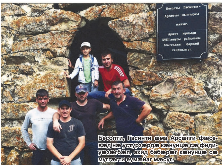
Бесолти, Гасинти æма Арсæгти фæсæвæдинæ устурæрдæ кæнунцæ сæ фидиуæзæгбæл, ахид бибæраг кæнунцæ сæ муггæгги еумайаг мæсуг.

Нæ Фидибæстæ цардгъон æма тухгин æй, фиццаги-фиццагидæр, æмцæдесонæй си ци аллихузон адæмтæ цæруй, уони æмвæндæвдийна-дæй. Еци адæмтæй ба алкæцидæр, намусгин æй, ци муггæгтæй арæзт æй, етæ еу бæласи уедæгги хуæн сæ еумайаг карнæбæл уозæлунцæ, уой цитгингæнæг æскъуæлхтдийнæдтæй. Еци æгъдау алли муггаг-мæ дæр фæлтæрæй-фæлтæрмæ 'и табуйаг, æнæмæнгæ æнхæсткæ-нуйнаг фæдзæхстæй хестæртæй лæвæрд цæуи кæстæртæмæ. Уомæ гæсгæ ба Иристони алли муггагмæ дæр ес, сæрустур цæмæй уонцæ, уæхæн гъуддæгтæ æма сæрбæрзонд кæмæй уонцæ, уæхæн адæймæ-гутаæ.