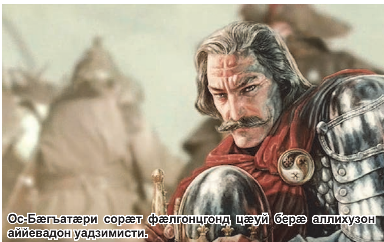
Ос-Бæгъатæри сорæт фæлгонцгонд цæуи берæ аллихузон аййевадон уадзимисти.

гонæй райгурдæй Ос-Бæгъатæр æма Æхсини уарзон фурт фурт Цъæхил. Еци фондземæй равзурдæй Ос-Бæгъатæри фæдон-тæ. Ном Ос-Бæгъатæр адтæй, паддзахеуæг ка кодта, уæхæн тугъдон раздзæуæг-фæтæги титул. Ос-Бæгъатæр цардæй 1260-1306 æнзти Нузали. Гæдиати Секъа куд финста, уотемæй æ ном хундтæй Гæба. Адтæй Уæллагри кæмтти æма Туалгоми раздзæуæг, æ рæстæги ахургонд, уæрæх зонундзийнæдти хецау, хъуарæй æнхæст, æ дзамани æнæгъæнæ Иристон е 'знæгги нихмæ ка исистун кодта æма е 'нсувæрти хæццæ еци уæззау рæстæги нæуæгæй нæ паддзахадæ ка исаразта, Иристонæй ка фæссурдта гурдзиаг æма мангойлаг æфсæдти. 1291-1296-1299 æнзти бампурста Гурдзимæ, басаста Гури, Рами æма Калаки фæдæрттæ, хъæбæр карзæй тох кодта уони æфсæдти нихмæ. Нæ адæми рагфидтæлтиккон зæнхитæбæл гурдзиаг æлдæрттæ æма азнауртæ ке æрхуæстæнцæ, уой зонгæй æма еци æверхъаудзийна-дæн нæ ниббухгæй, исфæндæ кодта уавæр исраст кæнун. Æма æ къохи бафтудæй – нур Картли æма Триалети ке хонунцæ, еци бæстæ. Кура-дони билæмæ Джерети коми Гæба исаразун кодта устур федал. Агъазиау æскъу-æлхтдзийнадæбæл банимайун æнгъезуй, уруси æма берæ æндæр адæмтæ уæд хъæбæр