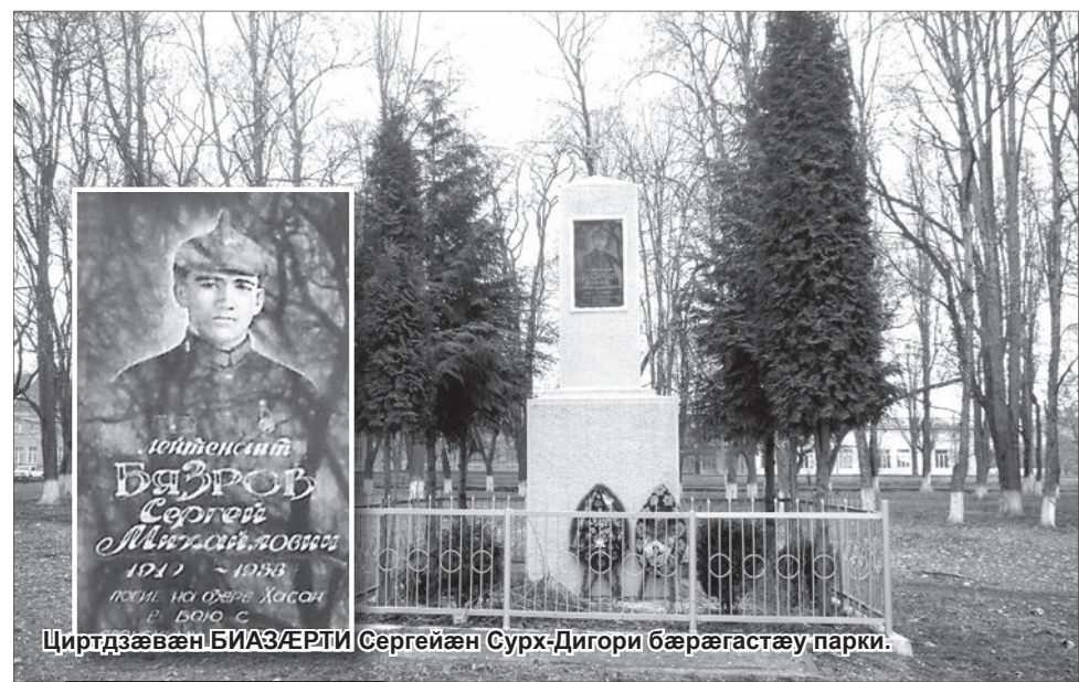
Циртдзæвæн БИАЗÆРТИ Сергейæн Сурх-Дигори бæрæгастæу парк.