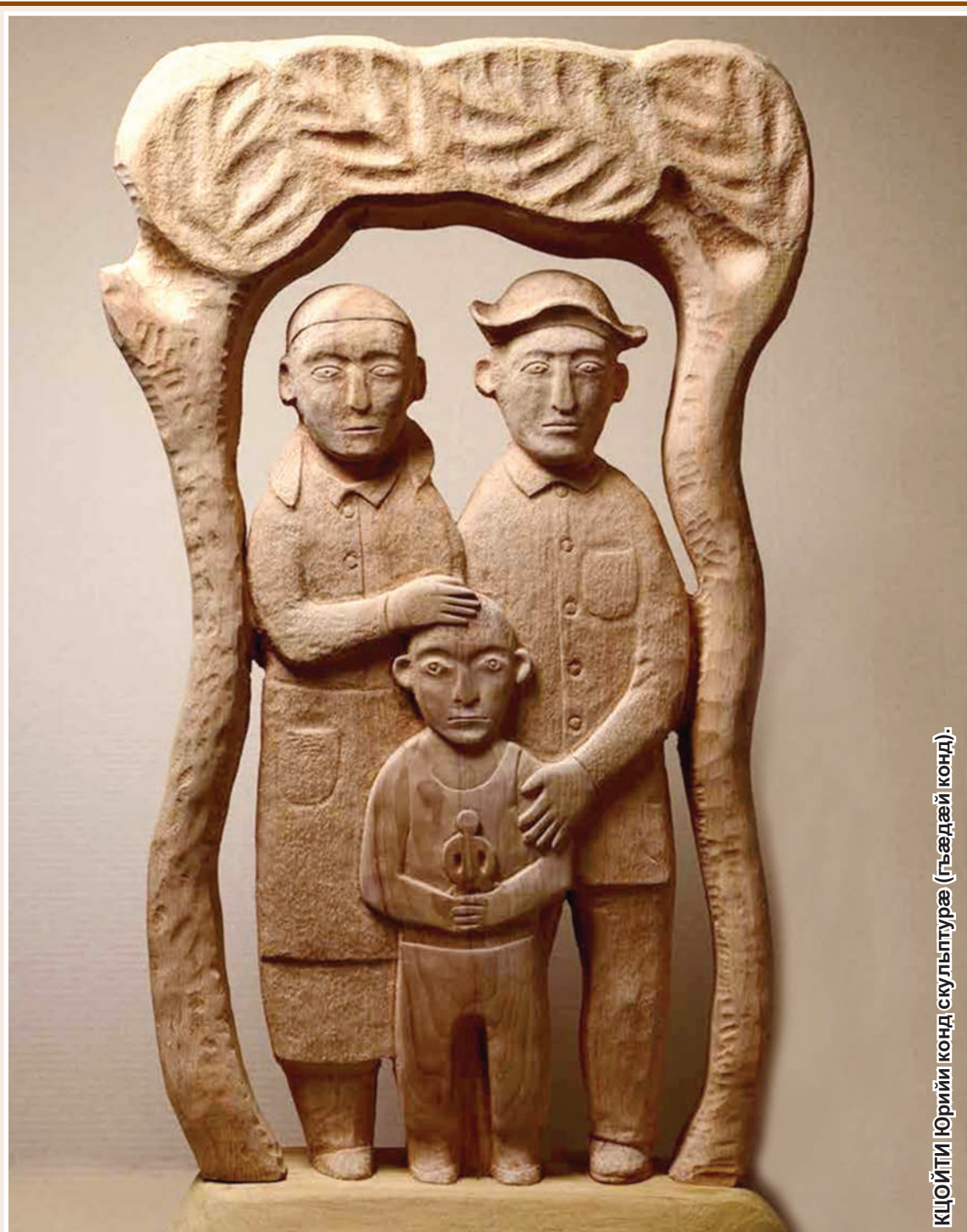
КЦОЙТИ Юрийи конд (скульптурæ (гъæдæй конд)).