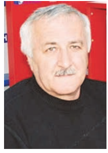
БЕСОЛТИ Ахсарæ, Уæрæсей журналисти Цæдеси иуонг

«Фидтæлти зæнхæбæл нæуæг фæлдæхт хуми баримахстон мæ уарзондзийнадæ. Нæ райхалдæй мæ деденæг. Йе дзаг думст бауæрæй нæ фæууæгъдæнцæ æ рæсугъд сифтæ арти æвзæгтау æма нæ базмалдæнцæ рагуалдзæги фæлмæн ирдгæмæ.