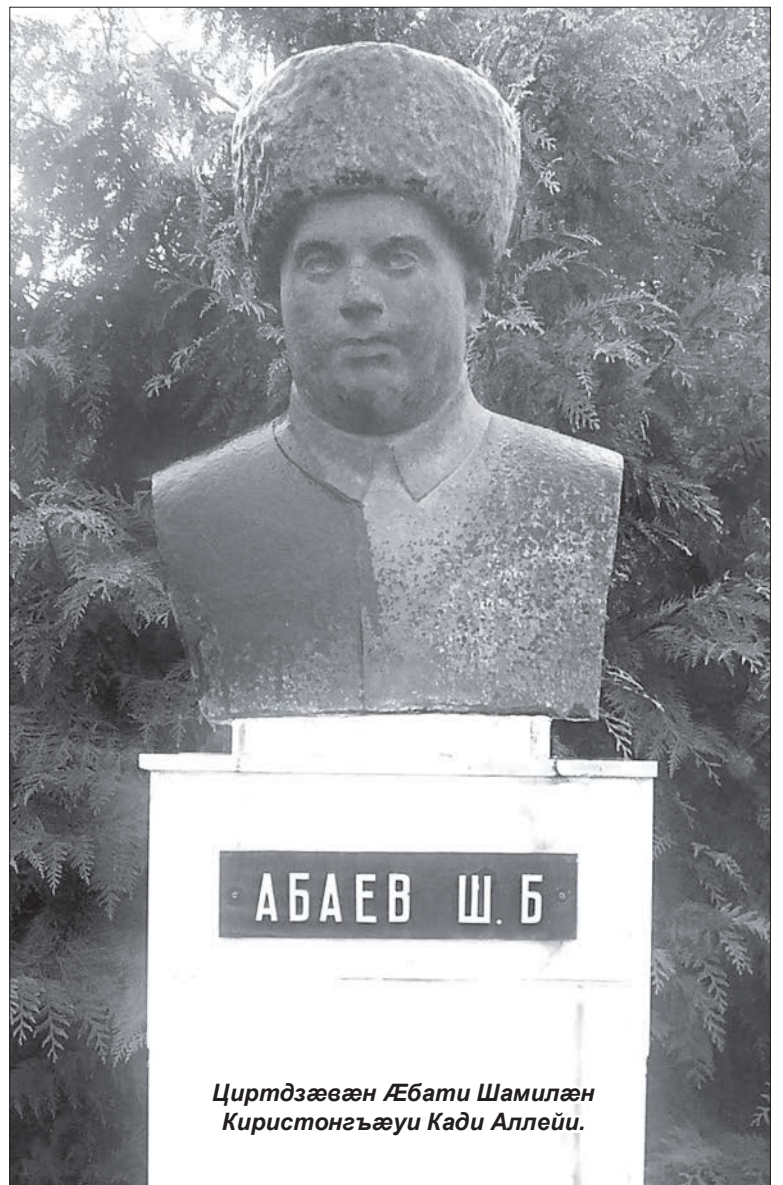
Циртдæвæн Абаты Шамилен Киристонгъауи Кади Аллейи.