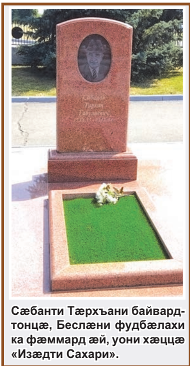
Сæбанти Тэрхъани байвардтонцæ, Беслæни фубæлахи ка фæммард æй, уони хæццæ «Изæдти Сахари».