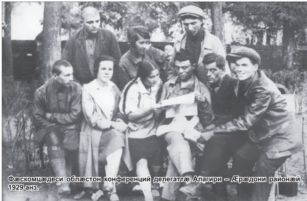
Фæскомцæдеси облæстон конференций делегаттæ Алагири – Æрæдони районæй. 1929 анз.