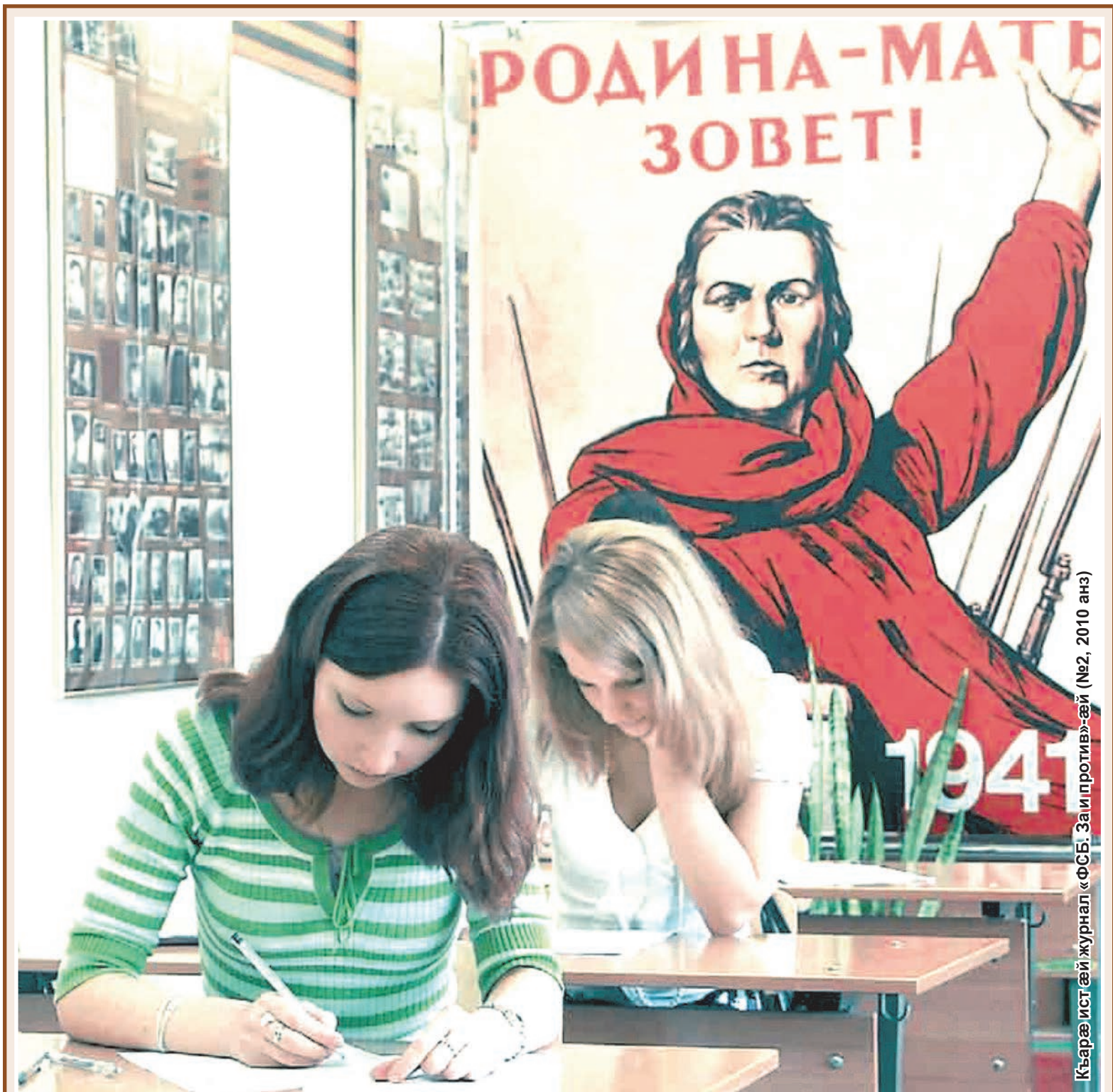
Къарæ ист æй журнал «ФСБ. Заипротив»-æй (№2, 2010 анз)