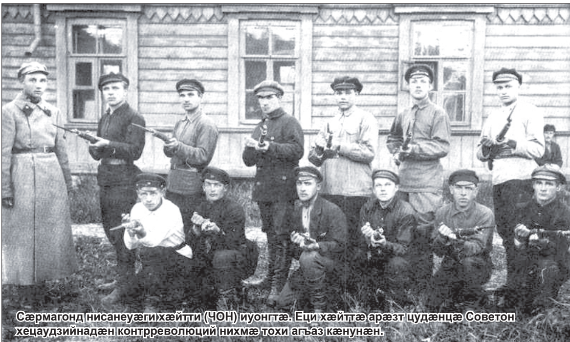
Сәрмагонд нисанеуәги хәйтти (ЧОН) иуонгтә. Еци хәйттә арәзт цудәнцә Советон хәцаудзийнадән контрреволюций нимхә тохи агъаз кәнунән.