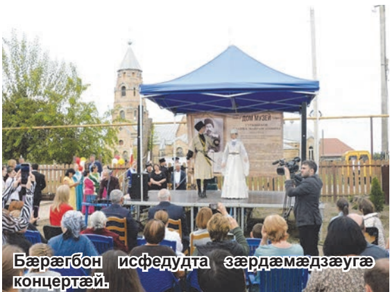
Бæрæгбон исфедудта зæрдæмæдзæугæ концерттæй.

Цитгин мадзали архайгутæ Гурджибети Блашкэй бюстбæл исæвардтонцæ деденгутæ. Хæдзарæ – музей байгони фæтқи рæ-