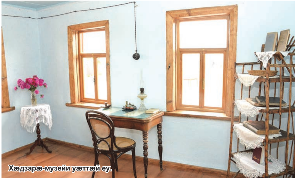
Хæдзарæ-музейи уæттæй еу.