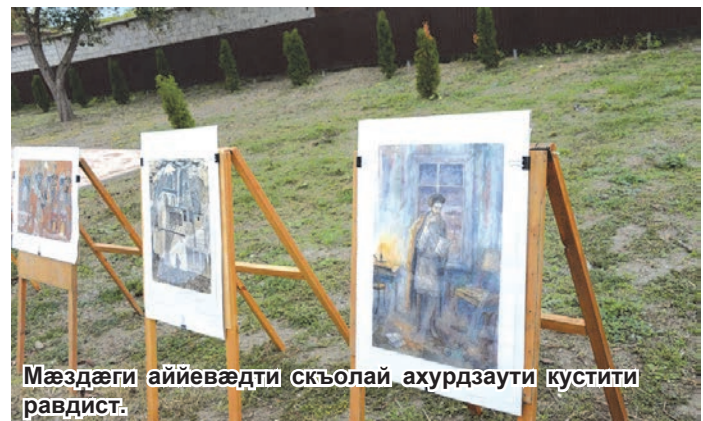
Мæздæги аййевæдти скъолай ахурдзæутти кустити равдист.