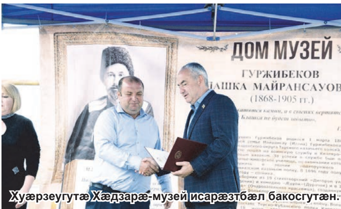
Хуæрзæугутæ Хæдзарæ-музей исаразтбæл бакосгутæн.