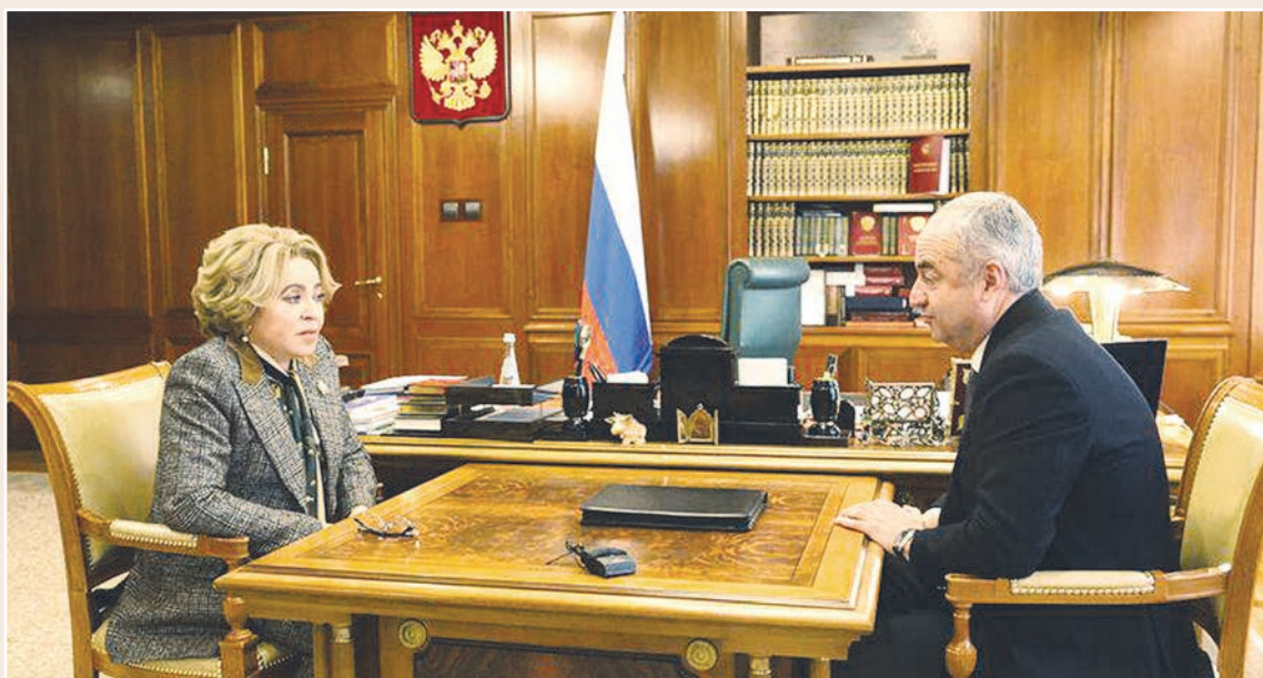
Нә республику нури Парламенти куст цәйбәрцәбәл әнтәстгин әма ахедгә 'й, уомән берә дәнцәнтә 'рхәссән ес. Уонәи еу ба е әи, әма ин устур аргьгонд цәуи Уәрәсей Федералон Әмбурди 'рдигәи дәр. Ә Сәрдар Валентинә МАТВИЕНКО уой әнәмәнгә баханхә кәнуи ТУСКЪАТИ Таймораз хәццә гьуддәгон фембәлдтити рәстәг.

ун багьәудзәәнәи. Фал мә бон ба 'й уотә зәгьун: сә еугур дәр агьаз кәнунцә, еуварсәи кәсәг си некә әи, кәдәртә ба си, сәрмагонд әфсәддон операци кәми әнхәстгонд цәуи, ордәмә дәр фәццәунцә гуманитарон уәзәгти хәццә, кәдәртә си агьаз кәнуи материалон әгьдауәи ка фәммард әи, уони бийнонтәән.