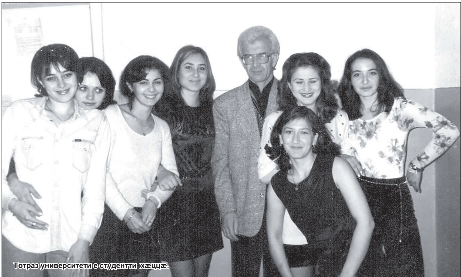
Тотраз университетти студентти хæццæ.

Уæдмæ берæ наукон уацтæ адтæй Тотразмæ, фал сæ фулдæр национ политикæ æма Устур тугъди рæстæгбæл. Мæ зæрдæ дардтон, бафтуйдзæнæй æ къохи, мæстаг, фæсмойнаг мæнæн нецæмæй уодзæнæй. Фал уæддæр сагъæсти бафтудтæн – уой дæр уомæ гæсгæ, æма бавналдта наукон-æртасæн, политикон æгъдауæй æгæр зин, уæззау темæмæ: «Национальная политика Советского государства на Северном Кавказе в годы Великой Отечественной войны 1941-1945 гг.» Уой фæдбæл цалдæр хатти фæдздзубанди кодтан, дузæрдугдзийнæдтæй нæмæ ци гудитæ фæззинидæ, уонæбæл, фал уæддæр фæдæрæй исфæндæ кодта аци темæбæл бакосун. Еци гуддæг цæйбæрцæбæл зин æнхæстгæнæн адтæй, е ба бæлвурд адтæй уомæй дæр, еци фарстамæ уæди уæнгæ наукон æхсæнади аккаг каст кенæ æгиридæр нæ цудæй, кенæ ба уæлæнгæйтти. Æма еци «нæхъæртондзийнадæ» банхæст кæнун бантæстæй Тотразæн.