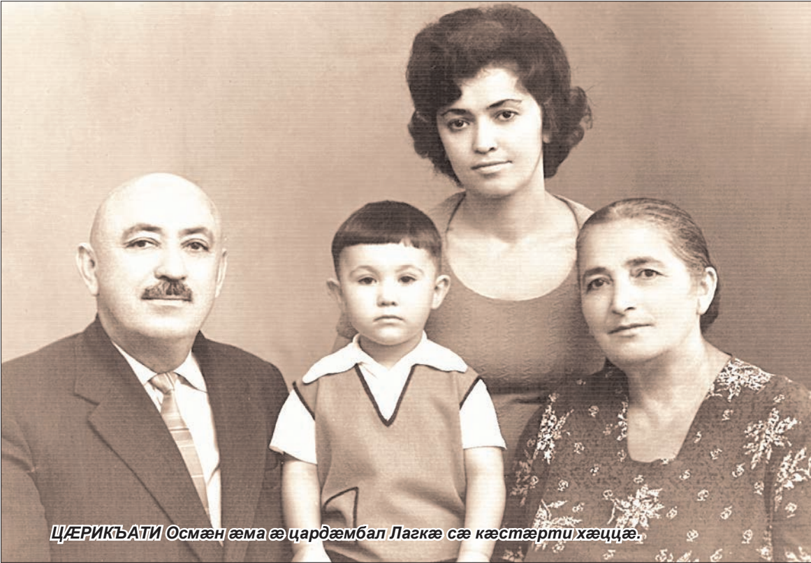
ЦÆРИКЪАТИ Осмæн æма æ цардæмбал Лагкæ сæ кæстæрти хæццæ.

Зундилæги æ ахургæнуйнаг бафарста: «Раст æй, æхца амонд-хæссæг нæ 'нцæ, зæгъгæ, еци дзубанди?..» Зундилæг ин равард-та дзуапп: «Е раст æй. Æхцайæй балхæнæн ес хуæруйнаг, фал си хуæрди мондаг нæ балхæндзæнæ; хуастæ балхæндзæнæ, æнæнездзийнадæ ба – нæ; ихуæрститæ балхæндзæнæ,