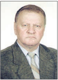
ЛЕГУЗАРТИ Саукуй (1943–2013) финсæг, публицист

КÆДДÆР Цæрикъати Дæхцихъо Цæголти Болай хæдзарæмæ минæвæрттæ ку барвиста, уæ кизгæ мæ фуртæн бийнойнагæн исаккаг кæнетæ, зæгъгæ, уæд си еу хабар æрцудæй æма 'й абони дæр чиколайæгтæ æрмисунцæ. Æримисунцæ 'й кæстæртæн зæрдæбæл дарунаен, цæмæй ма иронх кæна, уомæн. Цæмæй не 'хсæн цæра, уомæн. Цæмæй адæймаги сагъæстæбæл бафтауа, уомæн.