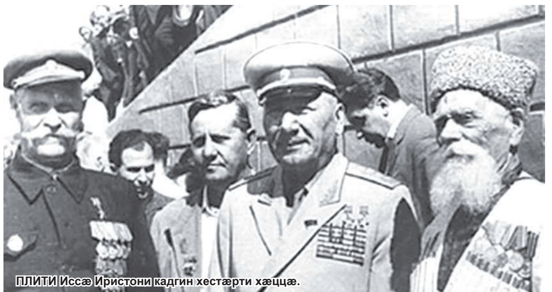
ПЛИТИ Иссæ Иристони кадгин хестæрти хæццæ.

Номдзуд тугъдон тæхæг Слонати Гæззини фурт/Алибеги райгурдбæл аци анз исæнхæст æй фондз æма фондзинсæй анзи (1918-1942). Æ ном æ райгу-рæн гъæу Кæрджини лæвард æрцудæй бунæттон скъола æма колхозæн.