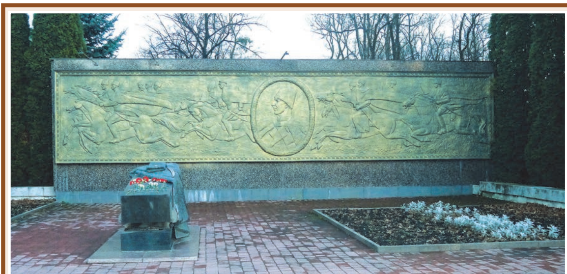
Зундгонд куд æй, уотемæй ПЛИТИ Иссæ уосиат кодта, цæмæй, æ цардвæндаги кæрон ку æрхъæрта, уæд æй Иристони зæнхæбæл – кæми райгурдæй, æ хæстæгутаем æма къабæзтæн се 'носон бунат кæми иссæй, еци рауæн байвæрун. Æма æ еци фæндæ æнхæстгонд æрцудæй – æ уæлзæнхон цардæй ку рахецæн æй, уæд æй байвардтонцæ Дзæуæгигъæуи Кади Аллейи.

Мах, заманхъуилæгтæ, абони сæрустур ан Иристони æскъæлтхдæр лæгтæй еубæл мах ном ке исæвардтонцæ, уомæй.