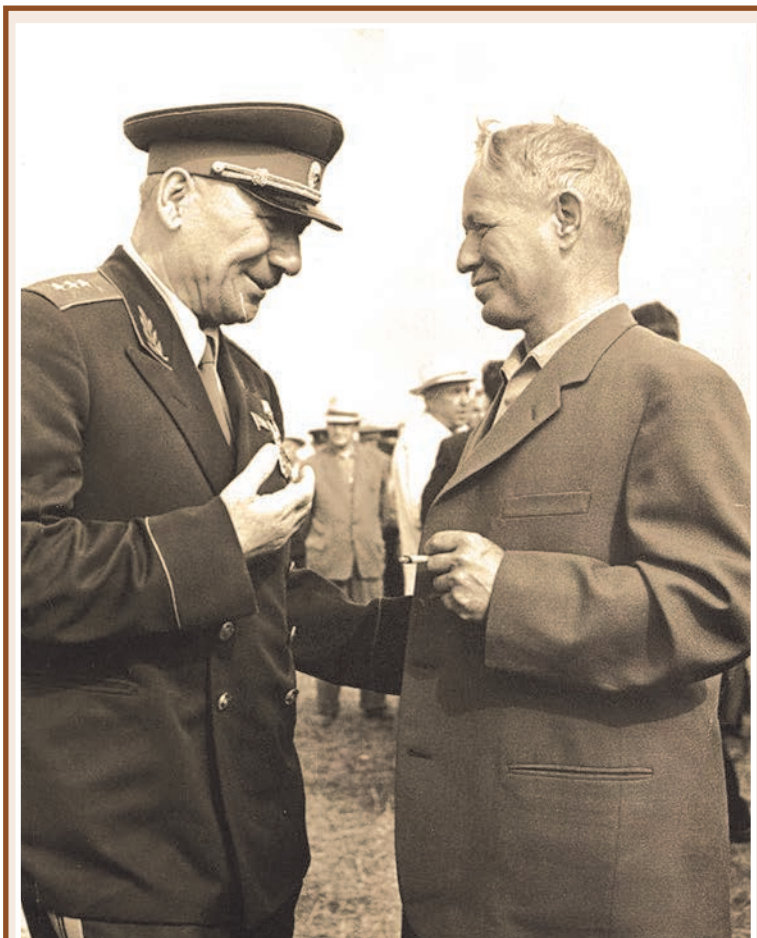
ПЛИТИ Исси хæццæ фембæлдтити фæдбæл ДАУРАТИ Дамир ци уацтæ ниффинста, уонæй еуеми ракой кодта, сæ дзубандий рæстæги 'й куд бафарста Михаил ШОЛОХОВИ туххæй, гъома, кæрæдземæ хæстæг цæретæ æма уе 'хсæн циуавæр рахастдзийнадтæ ес, зæгъгæ. Æма Иссæ зæрдиагæй загъта: «Нæ устур финсæг мæ устур æрдхуард æй. Æрæги дæр мæмæ æрбадзурдта, дæ хæццæ, дан, мæ æфсæддон ахуртæмæ фæххонай, нæ нури æфсæддонтæ нæуæг уавæрти куд архайунцæ, уой фæууинон... Уæхæн лæгæн «нæ», зæгъгæ, куд гъæуама зæгъгæй?! Хъæбæр аразийæй байзадæй не 'фсæддонтæй. Æма нæмæ æцæгæйдæр тухгин æфсад ес: дæсни æма ахургонд æфсæддонтæ...»

Аци хабар ба мин радзурдта нæ республики промышленности раздæри министр Байти Хъазбег. Е адтæй 1997 анзи. Уæд уой хæццæ еумæ фæттахан далæ