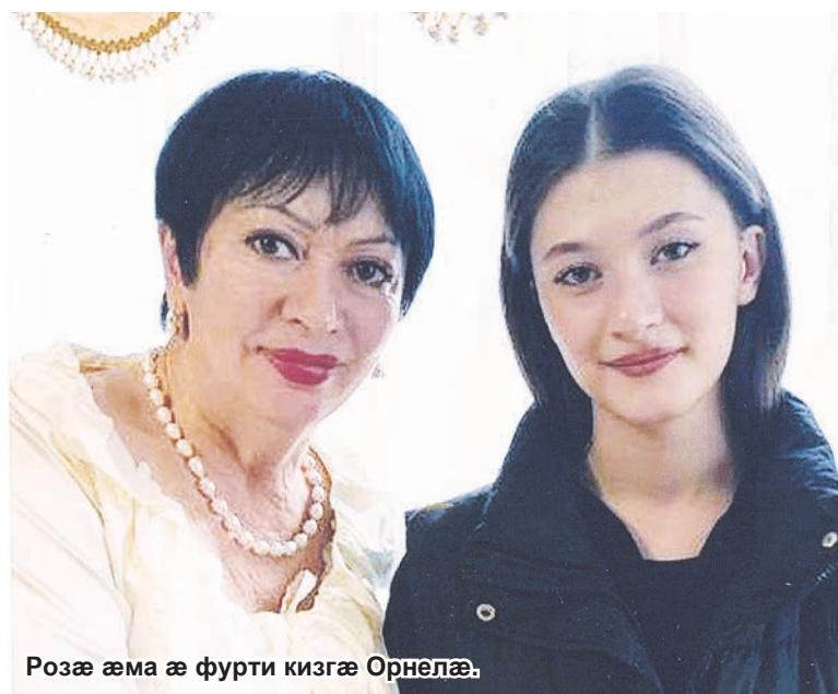
Розә әма ә фурти кизгә Орнелә.

базорунцә – кәмән укол икәнун гьәуи, кәмән – хуасә байамонун. Әма цийфәнди афонә ку уа, уәддәр некәд базийнадә кәнуй, бакәнуй ә агъази хай.