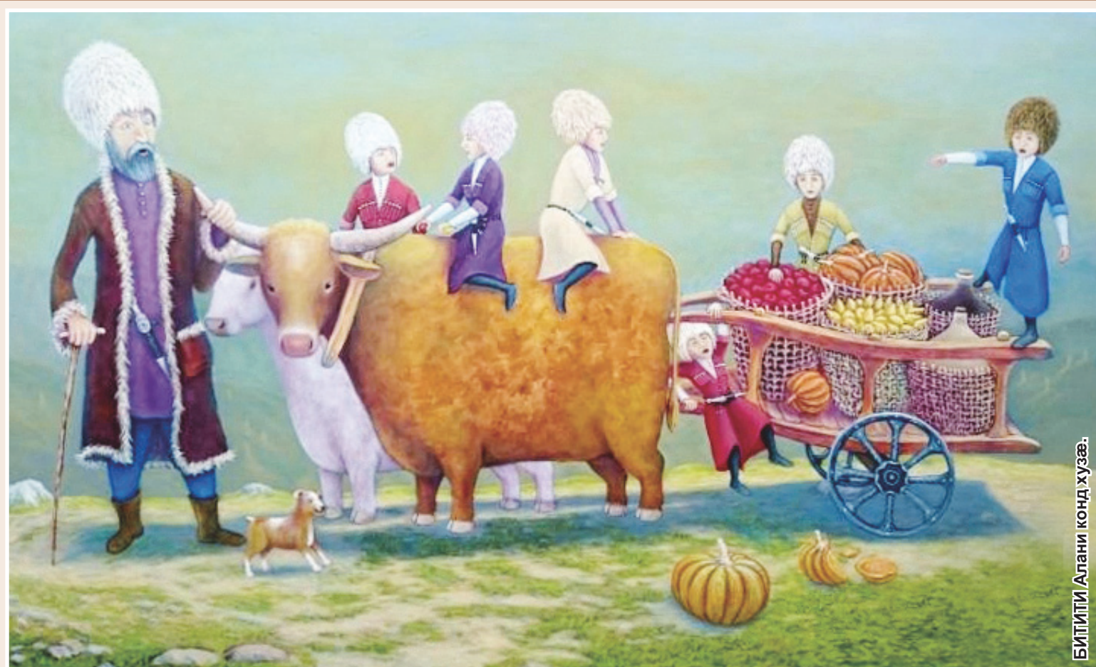
БИТИТИ Алани конд хуэ.