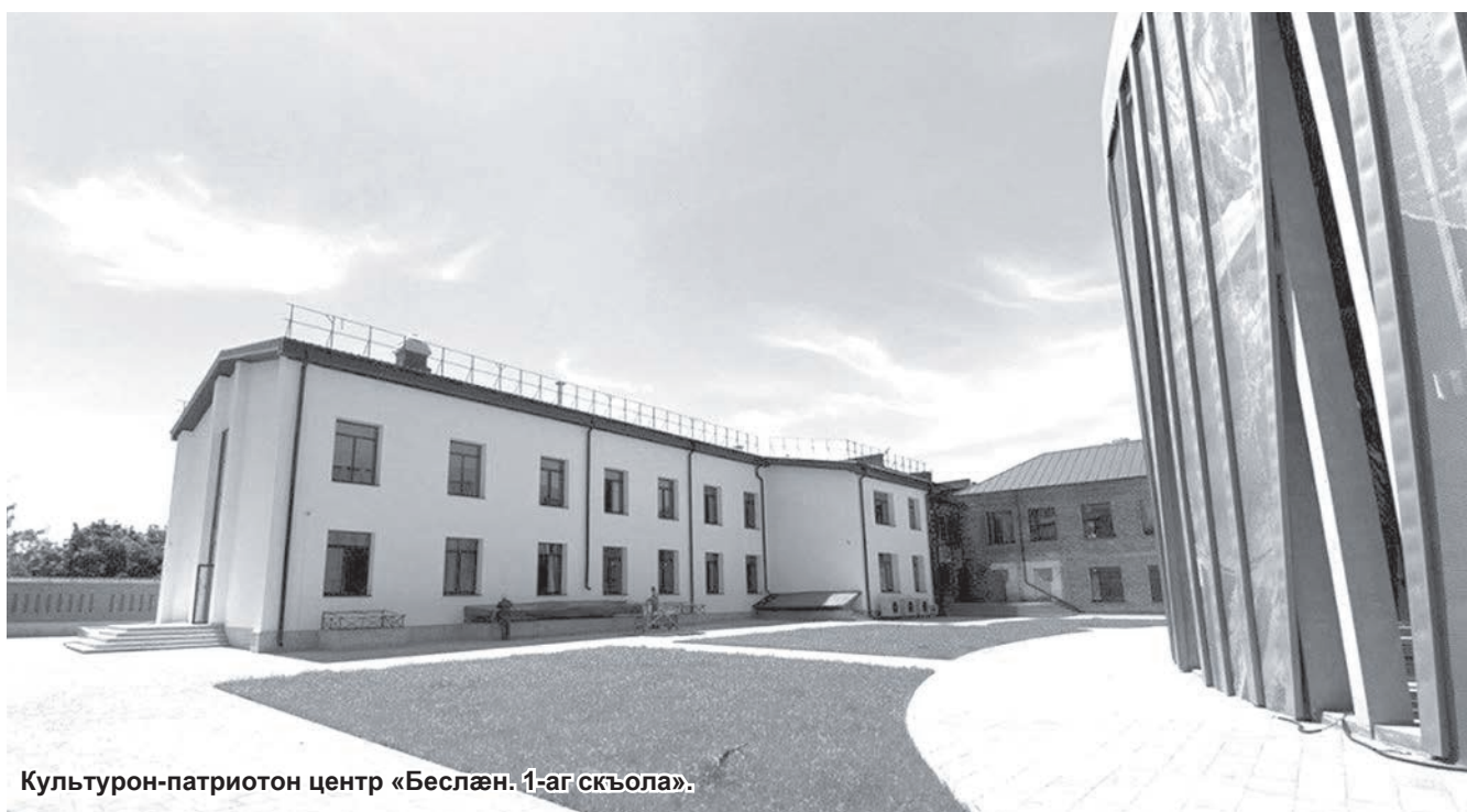
Культурон-патриотон центр «Беслэн. 1-аг скъола».