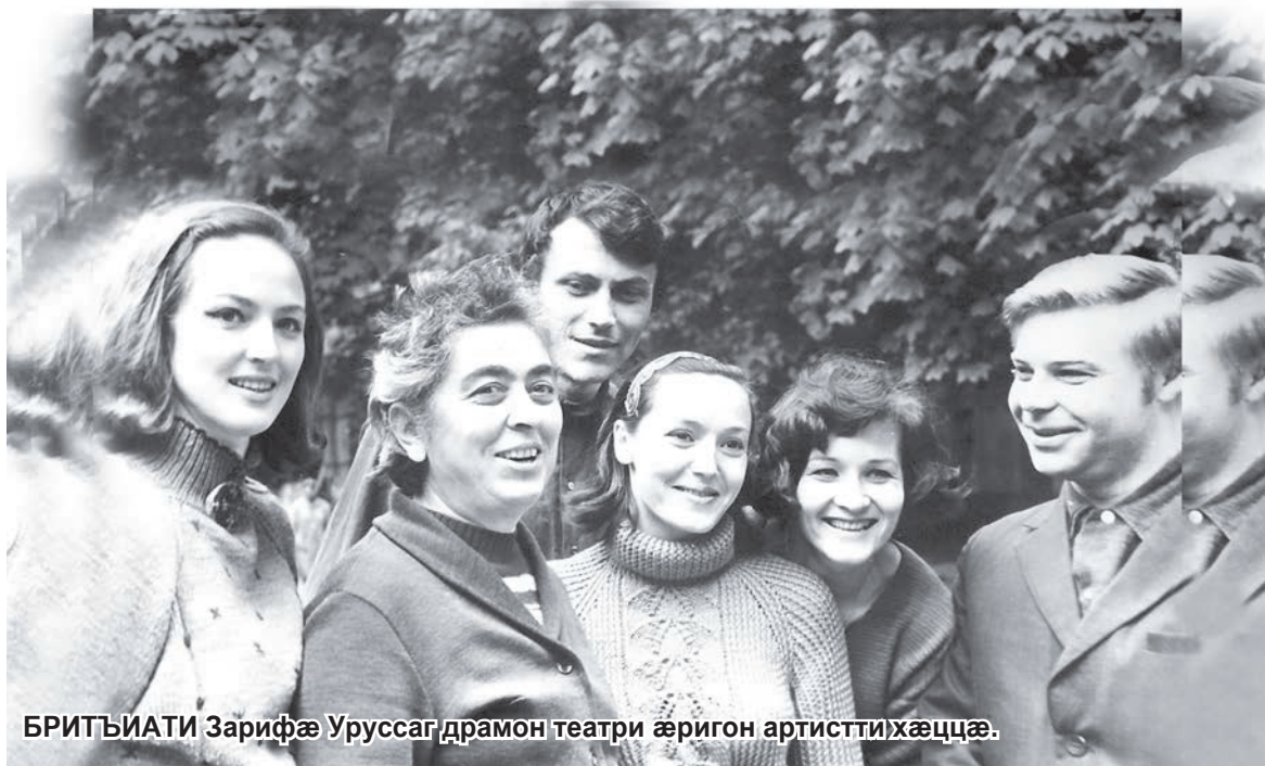
БРИТЪИАТИ Зарифæ Уруссаг драмон театри æригон артистти хæццæ.