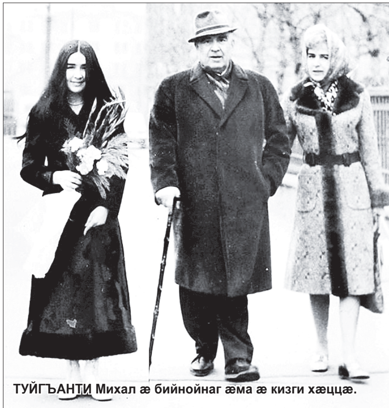
ТУЙГЪАНТИ Михал æ бийнойнаг æма æ кизги хæццæ.

бæрзæндтæмæ еци нифсгунæй ке цудæнцæ, кæрæдзæй хуарз ке лæдæрдтæнцæ, æвæдзи, уой туххæй алкæддæр сæ къохи дæр æфтудæнцæ зингæ æнтæстдзийнæдтæ.