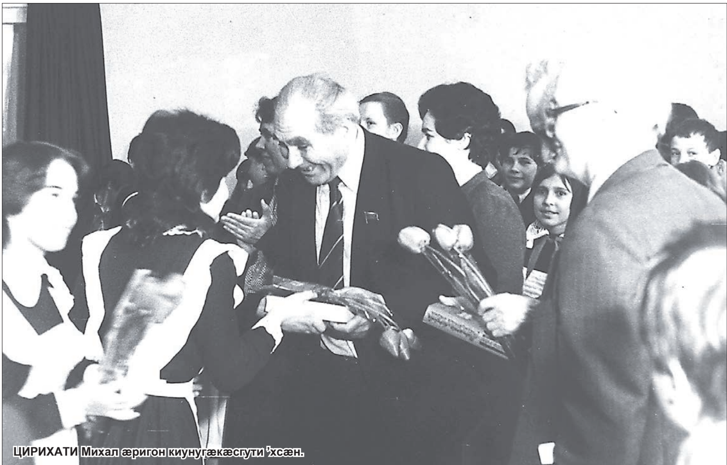
ЦИРИХАТИ Михал æригон киунугæкæсугти 'хсæв.

Зæхх ыстыæлфы гутæтты æфсæнтæй, Зæхх бæрæчет – тауинагæй бафсæст.