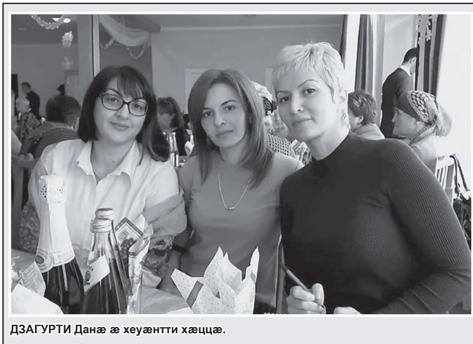
ДЗАГУРТИ Данæ æ хуæнтти хæццæ.