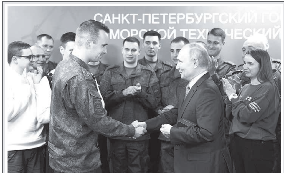
Владимир Путин аци анзи райдайæни Санкт-Петербурги падзахадон техникон университетти фембалдæй сæрмагонд æфсæддон операци архайæг студентти хæццæ.

Иннæ анзæй фæстæмæ бавналдзинан рæвдауæндæнттæ цалцæг кæнуннæ программæмæ. Скъолатæбæл ку дзорæн, уæд 2030 анзмæ аци фарста ралух кæнунмæ регионтæн фæййагъаз кæндзинан.