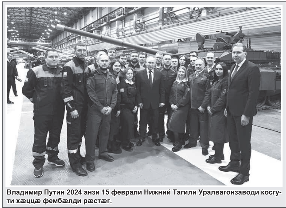
Владимир Путин 2024 анзи 15 феввали Нижни Тагили Уралвагонзаводи косгъути хæццæ фембæлди рæстæг.

Кустуæтти нæ фæллойнæгæнгутæ косунцæ æртигай кезуйæй, фронт цæйбæрцæ домуй, уойбæрцæ. Арфæ кæнун уонæн дæр, гъæуон хæдзаради косгутæн дæр. Адæм фронтмæ 'рветунцæ финстæгутæ, дзаумау, æхца, се 'фтуйаг уотæ берæ кæд нæй, уæддæр. Уæхæн агъазæн аргъ нæйис. Е æй нæ еумæйаг уæллахезмæ байвæрæн. Нæ тухтæ ку байеу кæнæн, уæд алцидæр нæ кьохи бафтуйдзæнæй.