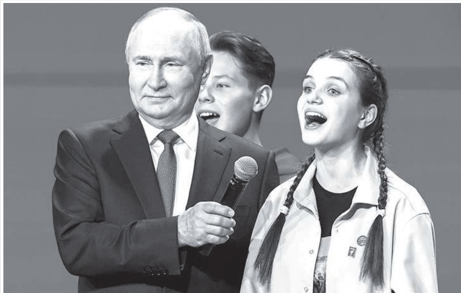
Владимир Путин 2024 анзи 1 феввали сувæллæнтти æма фæсевæди Уæрæсейæг æзмæлд «Фиццæгти æзмæлд»-и съезди, Уæрæсей Гимн заруни рæстæг.

Скъолатæ æма рæвдауæндæнтти капиталон цалцæгæн радех кæндзинан уæлæнхасæн 400 миллиард сомемæй фулдæр.