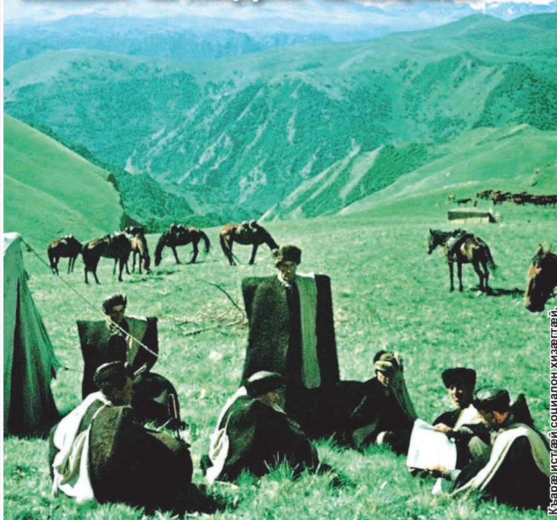
Къæрæ истæй социалон хизæгтæй.

Еугур рæстæгутæ дæр еугур адæмтæн дæр сæ цардиуаги тæккæ агъазиаудæр уидæ æма æй зæнхи фарста. Уотæ адтæй Иристони дæр, уæлдайдæр ба хуæнхбæсти. Зæнхи хæйттæмæ гæсгæ лухгонд цудæнцæ адæми 'хсæн рахастдзийнæдтæ, сæ цардиуаги хабæрттæ. Зондзийнæтæ 'й, Советон хецæудзийнадæ Уæрæсей нæуæг цардарæст ниффедар кæнунмæ ку бавналдта, уæд æ фиццаг Декреттæ адтæнцæ сабурдзийнадæ æма зæнхи туххæй – цæмæй еци дууæ гъуддаги хуæргæнæг уонцæ фæллойнæгæнæг дзиллитæн. Æма, зæгъæн, кæд зæнхæ уой размæ фулдæр хæттити исуидæ æх-