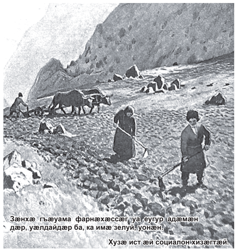
Зæнхæ гъæуама фарнæхæссæг уа еугур адæмæн дæр, уæлдайдæр ба, ка имæ зелуй, уонæн. Хузæ ист æй социалон хизæгтæй.