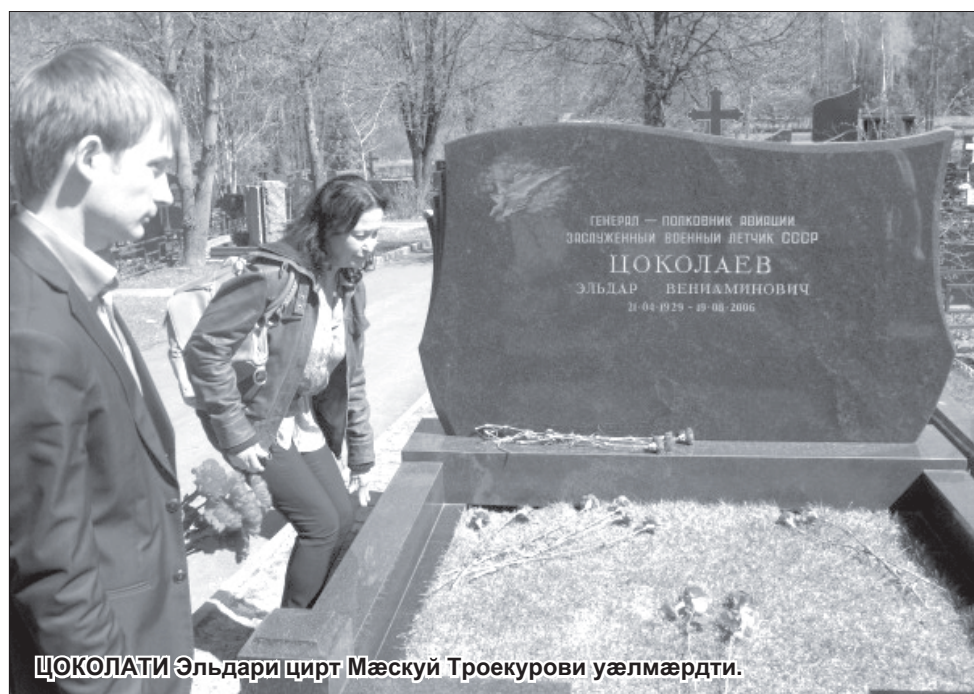
ЦОКОЛАТИ Эльдари цирт Мæскуй Троекурови уæлмæрдти.