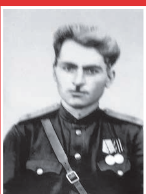
ГАБЕТИ Урузмæги фурт Гург'охъ