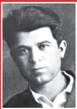
ГЕРИТИ Данели фурт Петр