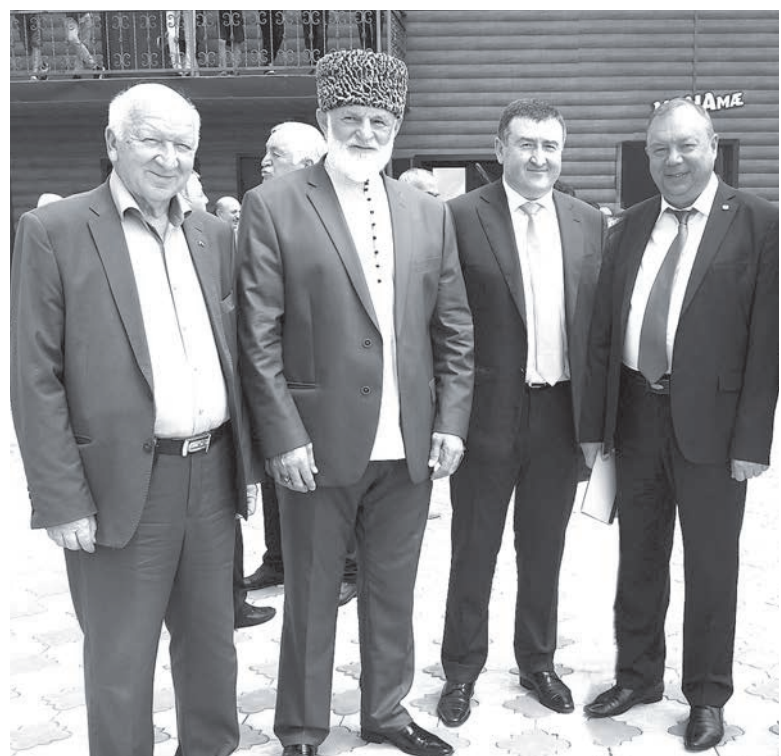
ТОХЪАЙТИ НОХ, ЦÆГАТ ИРИСТОНИ МУФТИЙ ГУÆЦЕЛТИ ХАДЖИМОРАТ, ЗУНДГОНД ПОЛИТИКОН ÆМА ХÆДЗАРАДОН АРХАЙÆГ ХИДИРТИ БАТРАЗ ÆХСÆНАДОН ЦИТГИН МАДЗАЛИ.

– Æз сæрустур дæн, æгайтми мин ес уæхæн разæгъди æм-