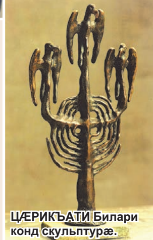
ЦÆРИКЪАТИ Билари конд скульптурæ.

Цæрикъай-фурти конд скульптуритæ æма Санай-фурти хузæгæндтитæ, æцæгæйдæр, сæ искондæй дести æфтаунцæ, ка сæмæ кæсуй, уони зæрдити ба æвзурун кæнунцæ рохс зæрди-уагæ, хуæрзуагон сагъæстæ æма гъудитæ. Равдисти туххæй æрмæг кæсетæ 4-аг фарсбæл.