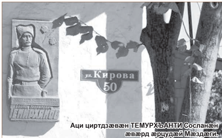
Аци циртдзæвæн ТЕМУРХЪАНТИ Сосланæн æвæрд æрцудæй Мæздæги.